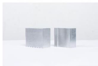
汽车 ABS 阀体毛坯