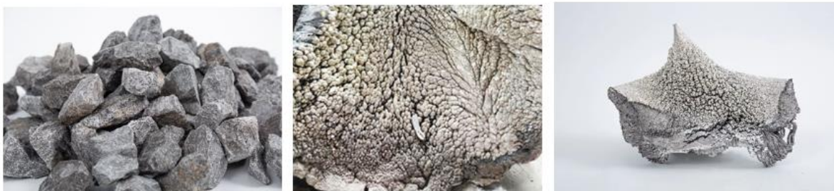
(白云石矿-原镁-镁合金)

公司目前拥有 10 万吨原镁产能及 20 万吨镁合金产能。公司在巢湖新建 5 万吨原镁产能、在五台新建 10 万吨原镁和 10 万吨镁合金、在青阳新建 30 万吨原镁和 30 万吨镁合金。