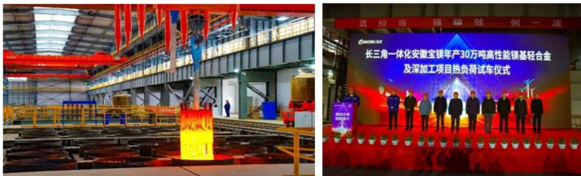
(安徽宝镁轻合金项目镁生产线热负荷试车仪式现场)

安徽宝镁轻合金项目已于 2023 年 12 月 23 日镁生产线热负荷试车启动。