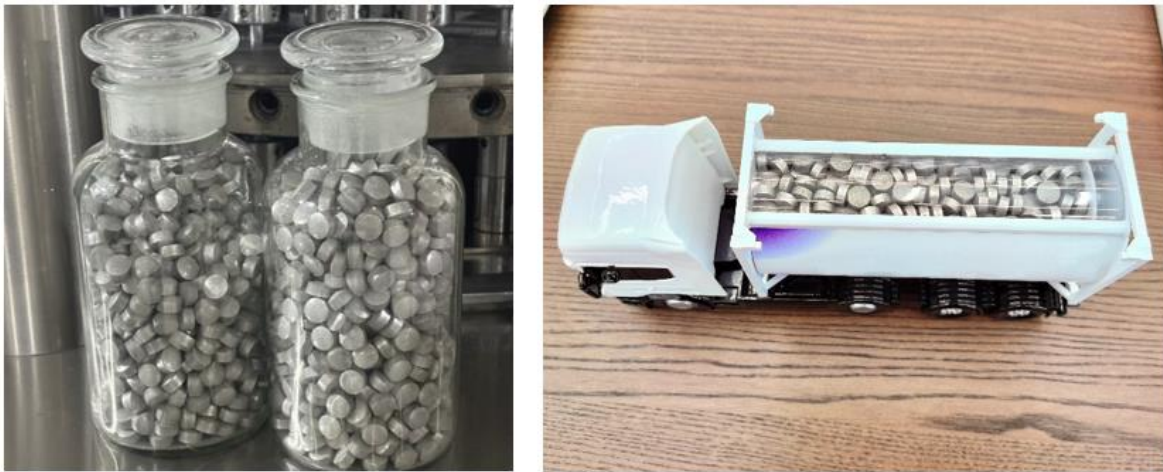
(镁基固态储氢材料)