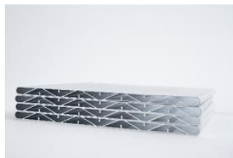
新能源储能系统口琴管