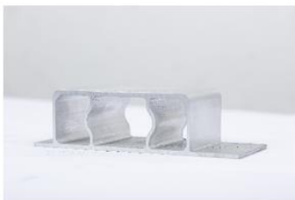
汽车防撞梁系统部件