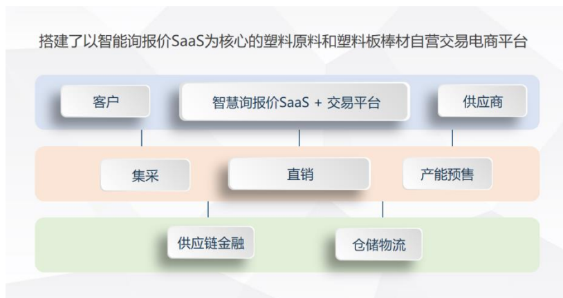
图 3：同益云商业模式