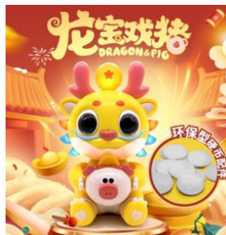
(龙宝戏猪及低碳版硬币配件)

此外，公司积极响应绿色低碳发展的号召，致力于低碳环保新材料的研发，并应用到公司的玩具产品；2022 年公司与中国科学院深圳先进技术研究院及深圳中科翎碳生物科技有限公司联合成立了“低碳材料联合创新中心”，致力于研发可降解、低碳乃至零碳的玩具产品所需相关材料，继 2022 年 11 月该中心研发了首款碳中和蛋壳玩具产品后，于 2024 年 3 月底再次研发出了低碳版龙宝戏猪的硬币配件。