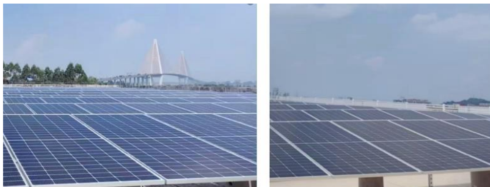
(公司投建的分布式光伏电站)

和应用，从光伏产业链端整合资源协同布局，从投资光伏组件厂、开发投资及运营光伏电站、承接光伏电站 EPC 承包项目，打造新能源业务的闭环生态链发展。