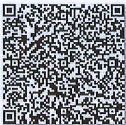
于颖的年检二维码

同意调出 Agree the holder to be transferred from