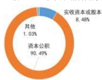
图 2：截至 2023 年末公司所有者权益构成