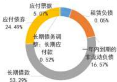
图 1：截至 2023 年末公司总债务构成