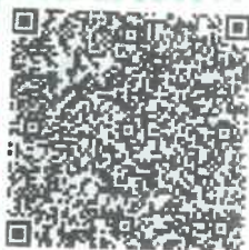
冯高的年检二维码

本证书经检验合格，继续有效一年。 This certificate is valid for another year after this renewal.