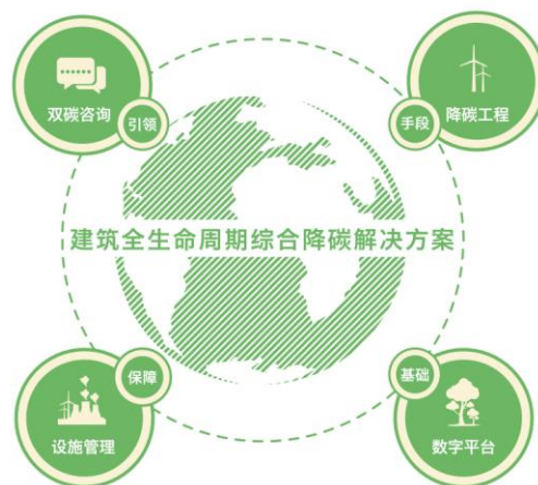
延华绿色双碳与数字能源业务全生命周期管理和服

在国家和地方各个领域“双碳”政策的加持下，节能服务产业保持快速发展态势。控股子公司东方延华公司作为上海市节能行业的头部企业，致力于将节能服务与数字化、智能化深度融合发展，围绕“安全、健康、绿色、智能”战略核心，开展双碳咨询、数字能源、降碳工程、智慧运维等建筑全生命周期的服务与运营。“双碳”背景下，低碳与数字能源版块将发力大型建筑和重点用能单位的碳资产管理服务，内容涉及碳审计、碳核算、碳纳入、碳监测、碳报告、碳交易、碳清缴等全过程的碳资产管理业务，助力双碳目标达成。