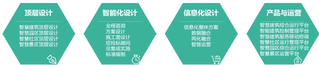
延华智慧城市与云平台业务全生命周期管理和服

智慧社区等建筑细分领域持续发力，为城市及建筑提供从顶层设计与咨询、智能化设计、信息化设计、平台运营、改造焕新等全生命周期的解决方案；助力解决城市运营、管理，提供城市智慧运行、统一管理和精准服务等发展过程中的疑难问题，助力数字中国建设、助力企业发展新质生产力，提高城镇运营管理服务水平和人民生活幸福感，增强城镇综合竞争力。