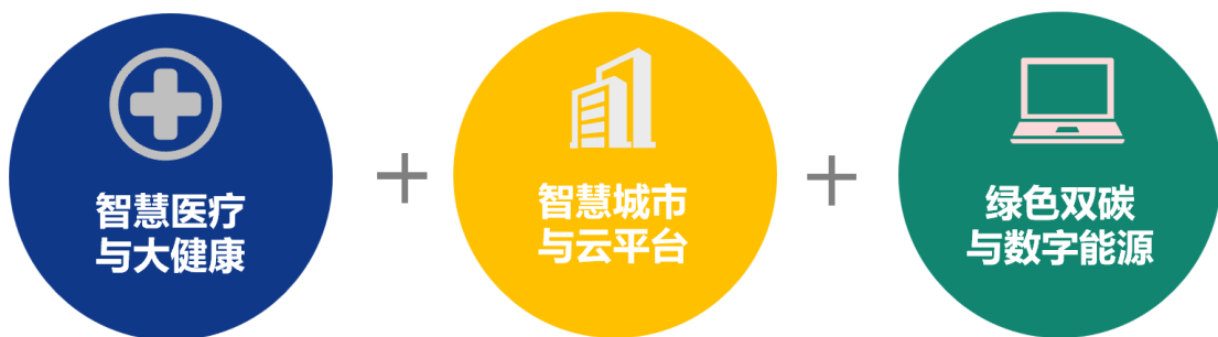
延华智能三大业务领域

报告期内，公司继续围绕“智慧城市、智慧医疗建设、运营和服务的综合提供商”的战略定位，聚焦智慧医疗与大健康、智慧城市与云平台、绿色双碳与数字能源三大业务板块，提供“安全、智能、绿色、健康”的全生命周期建设、运营和管理服务。作为智慧城市领域持续拓展耕耘的高科技企业，秉承“分享、合作、创造”的文化理念，通过各项技术的应用结合行业经验积淀，钻研探索各类创新解决方案，赋能智慧城市各领域的管理与服务。通过全生命周期的业务模式，在城市建设与运营环节配备延华云平台产品，为城市管理提供更高效、更精准的服务。