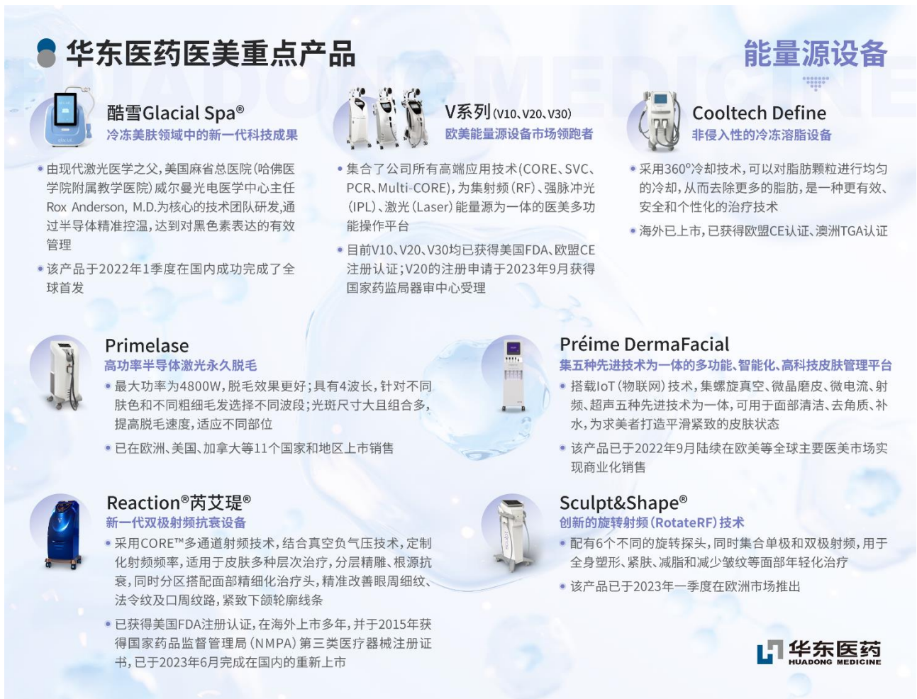
图：华东医药重点医美产品

报告期内，欣可丽美学以公司品牌为主体，带动旗下多个子品牌协同发展，持续推出优质产品，逐渐完善产品矩阵，联动全球研发及医学资源，强化在 B 端机构影响力以及 C 端求美者的知名度，建立“专业”、“美学”、“高端”的品牌形象。在产品层面，公司在 2024 年 6 月于上海首发 Ellans e®伊妍仕®第二代新品——伊妍仕®臻妍™、伊妍仕®紧妍™、伊妍仕®致臻™3 款高端再生型面部填充剂，是在参考市场反馈及遵循医生注射习惯等基础上升级推出的第二代新品，进一步强化了在国内高端抗衰领域的领导地位以及产品矩阵。与第一代相比较，不仅将核心成分 PCL 微球细分为大、中、小三种不同粒径类型，解决不同层次的抗衰需求，同时还对产品的外包装做了破坏性开盒设计等质量安全升级措施，进一步升级正品验真保障，以保护消费者权益。第二代新品上市后获得了市场的高度关注和认可，截止目前已超过 100 家机构引入该新品。后续第一代 Ellans e®伊妍仕®原微球作为再生领域的基础类产品，将让更多的求美者有机会体验 PCL 微球自然再生效果，同时第二代新品组合将迎合当下求美者最“个性化”美态的主流需求，分层抗衰，专品专效，有望继续引领国内高端医美市场需求升级。