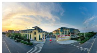
上海悦心泗洪康养中心