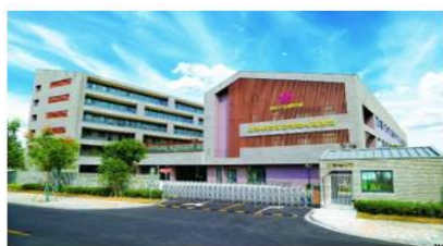
上海奉贤金海悦心颐养院

依托于悦心照护体系的完善和专业团队的壮大，“悦心·漫活欣成”、“悦心·安颐别业”、“悦心照护教育培训”三个产品线，互相支持、互为依托，形成齐头并进的发展态势。