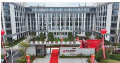
温州龙港市医养康教研示范园

公司医疗业务包括综合医院及专科医疗服务。公司已陆续投资的医疗机构及合作项目包括：安徽全椒同德爱心医院、江苏泗洪分金亭医院、江苏泗洪安颐医院（宿迁安颐老年病医院）、美国日星生殖中心、江西宜春市妇幼保健院妇产