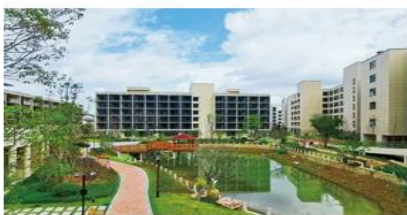
温州东方悦心中等职业技术学校