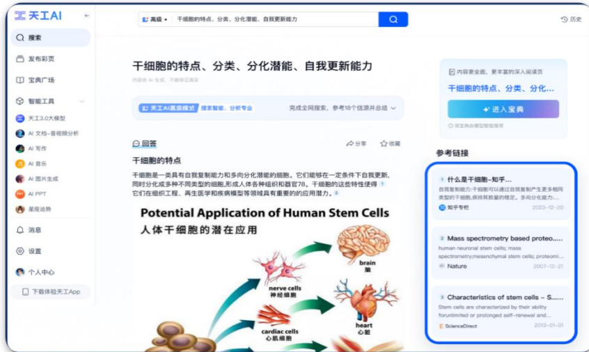
高级搜索模式展示

其次是彩页。作为一种全新的内容形态，其提供多样且丰富的阅读体验，涵盖影视、财经、科技、娱乐等各个领域。用户只需在天工首页轻轻下滑，即可浏览精彩纷呈的彩页内容，并根据个人喜好，选择关注不同的内容标签，实现个性化推荐。用户还可以通过天工首页左侧的“发布彩页”功能，轻松创作并发布彩页，分享自己的知识和爱好。创建彩页的方式多种多样，既可以通过一句话描述快速生成，也可以基于已有文本、链接或文件进行制作。彩页不仅可以发布到首页供其他用户点赞和收藏，还可以用于制作个人的工作或学习 PPT。