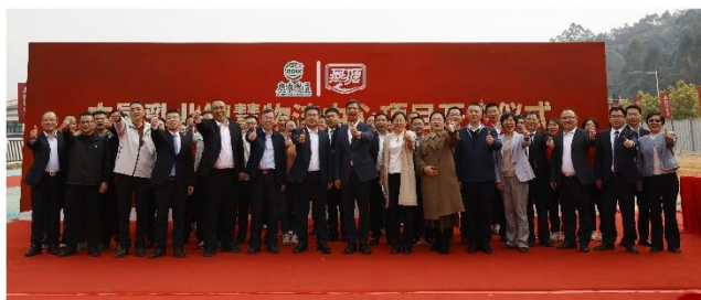
2025年2月18日，广垦乳业智慧物流中心开工仪式

2024 年，结合公司产业集群的方案安排，公司审议通过了《关于拟对外投资建设项目的议案》，拟投资建设广垦乳业智慧物流中心项目和粤东日产 600 吨现代化乳制品加工厂建设项目，截至披露日，广垦乳业智慧物流中心项目已开工建设，粤东日产 600 吨现代化乳制品加工厂建设项目已完成土地购置。其他产业集群项目正在有序推进中。