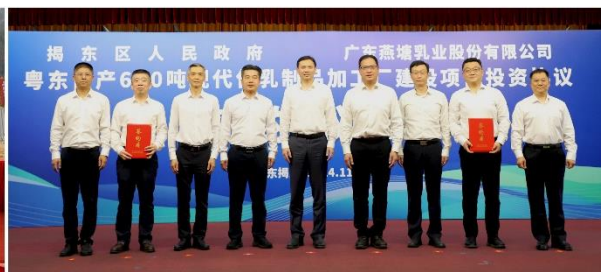
2024年11月5日，与揭阳市揭东区人民政府签订粤东乳制品智能旗舰工厂投资协议