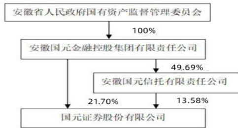
公司与实际控制人之间的产权及控制关系的方框图