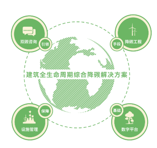
延华绿色双碳与数字能源业务全生命周期综合降碳管理和服务

报告期内，公司以“安全、健康、绿色、智能”为核心战略导向，深度推动节能降碳服务与数字化、智能化技术的融合创新，聚焦建筑全生命周期场景，构建并开展双碳咨询、数字能源、降碳工程、智慧运营于一体的综合服务与运营体系。在“双碳”国家战略深入推进的背景下，公司聚焦绿色双碳与数字能源核心业务，重点布局公共机构、重点用能单位及大型建筑核心领域，依托全生命周期综合降碳管理服务模式，全面覆盖碳审计、碳核算、碳监测、碳报告、碳交易、碳清缴等碳资产管理全流程，切实助力客户实现双碳目标，推动行业绿色低碳转型落地见效。