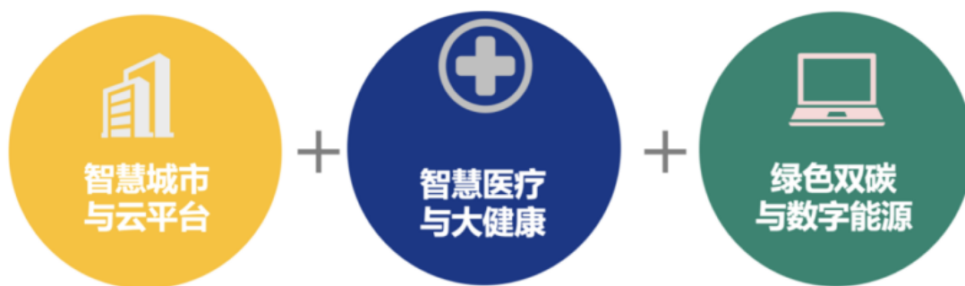
延华智能三大业务领域

报告期内，公司继续围绕“智慧城市、智慧医疗建设、运营和服务的综合提供商”的战略定位，聚焦智慧城市与云平台、智慧医疗与大健康、绿色双碳与数字能源三大业务板块，提供“安全、智能、绿色、健康”的全生命周期建设、运营和管理服务。作为智慧城市领域持续拓展耕耘的高科技企业，秉承“分享、合作、创造”的文化理念，通过各项技术的应用及多年来行业经验积淀，钻研探索各类创新解决方案，赋能智慧城市各领域的管理与服务。