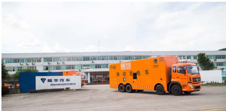
畅丰专汽移动发电车