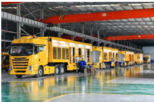
畅丰专汽应急电源车

公司全资子公司畅丰专汽主营专用汽车的研发制造，畅丰专汽为国家级高新技术企业、国家“专精特新”重点小巨人企业、国家知识产权示范企业，主要生产应急电源车、移动储能充电车、电力工程车、旁路作业车、无人机巡检指挥车、应急通信车、抢险救援照明车、大流量排水抢险车等应急装备车辆。畅丰专汽是国家工信部许可的专用车生产企业，是中国一汽、二汽、中国重汽、江淮汽车等大型车企的定点改装车辆厂，是国内重要的特种车辆设备和应急服务的提供商、国家援非电力应急装备制造商。公司产品行销国家电网、南方电网、国家应急管理部所属各救援队、国内“三大”通信运营商、大型矿山及油田等。