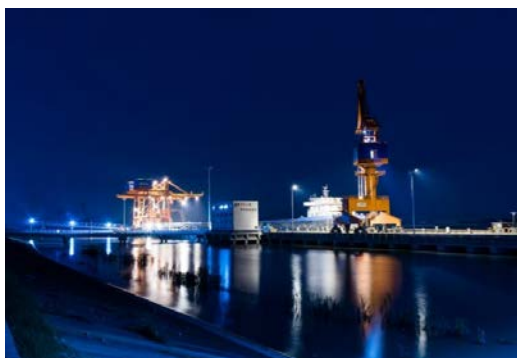
安徽中桩物流港码头