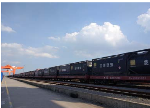
兆华集团沥青特种集装箱物流

公司现代物流业务中，全资子公司兆华集团从事的沥青供应链业务占比较大，兆华集团立足于沥青产业，以沥青特种集装箱的物流服务、沥青的改性加工与仓储、基质沥青产品仓储及电商平台为主要业务，相互结合，相互促进，构建了沥青供应链的完整业务链条。其业务模式主要是：从上游石油化工企业（炼厂）通过集采分销的方式采购基质沥青，经过运输、仓储、改性加工，以战略合作与参加投标等方式获得业务机会，有针对性地向下游道路施工企业供应符合其需求的沥青产品。兆华集团拥有丰富的行业经验，对各类型客户的需求理解深刻，借助其沥青特种集装箱物流的核心优势，整合资源，完善物流网络，根据客户需求提供定制化的沥青供应链解决方案，持续打造高品质沥青供应链服务。