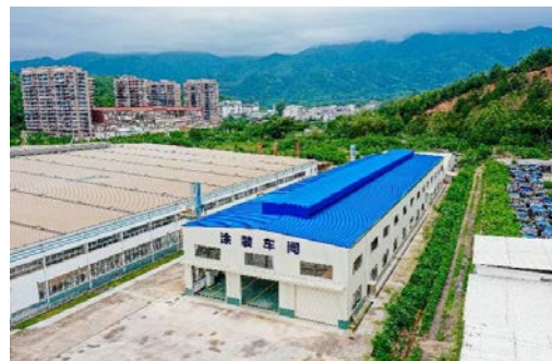
畅丰专汽涂装车间