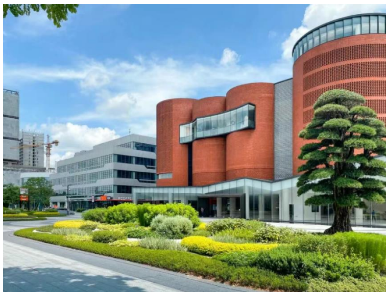
（设计项目：广东雪蕾香氛文化产业基地）

公司深耕城乡发展及生态环境建设业务领域超过四十年，已构建成“规划-设计-施工一体化”的综合建设平台。公司城乡发展及生态环境业务主要分为规划设计业务和建设业务两大板块，规划设计业务以构建集规划、建筑、景观、资源管理为一体的设计业务平台，为客户提供贯通生态、土地利用、民生、产业及建设落地实施的综合性设计服务；工程建设业务分为生态园林建设业务与建筑工程建设业务。无论是工程建设业务还是规划设计业务，业务模式相对成熟，主要分为项目信息收集、业务承接、组织投标、组建项目团队、项目实施、工程竣工验收/完整设计图纸提交和项目结算、后期维保养护、项目运营等阶段。