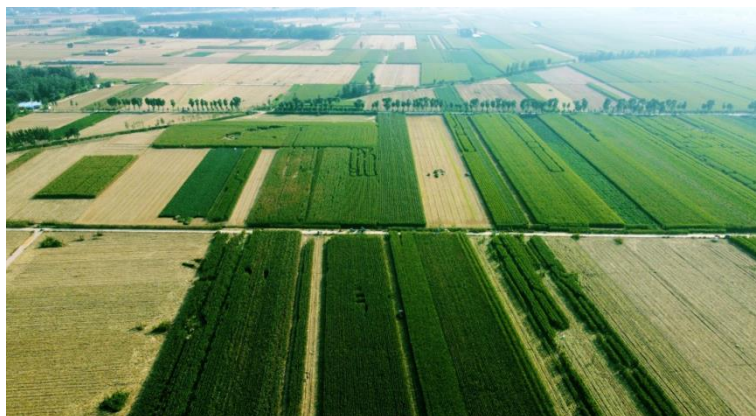
（高标准农田项目：清丰高标准农田建设项目）