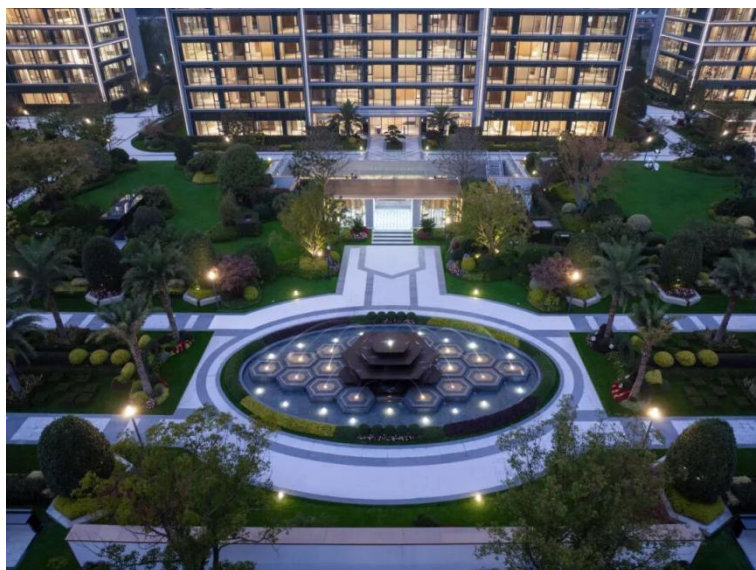
（工程项目：杭州棠前嘉座）