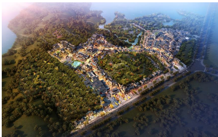
（文旅运营项目：时光贵州）

合作升级酒店设施与服务。公司通过一系列举措促进相关资产的保值增值，提升运营效益。