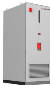
浸没式储能一体柜