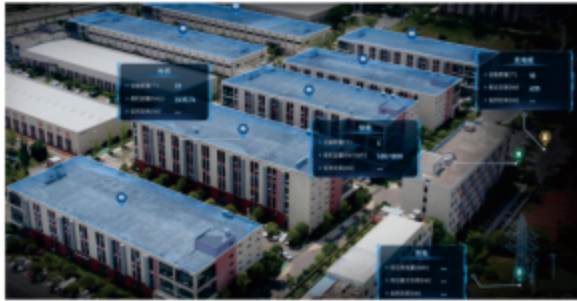
图3-4 智能微电网项目-简阳新经济产业园