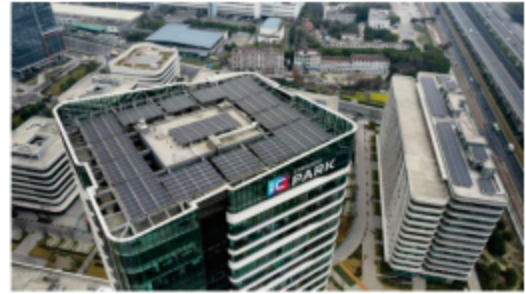
图3-5 智能微电网项目-IC设计产业园