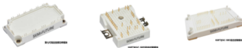
图3-8 功率半导体相关产品

报告期，森未科技推进第8代IGBT技术平台开发，同步搭建SiC器件测试研发平台，推动技术成果转化；整合研发资源和供应链能力，构建“市场导向-技术攻关-产能释放”全流程闭环管理；组建中台部门，开展市场与用户研究、产品规划、项目协同与产品生命周期管理，强化市场销售和产品研发的衔接与协同，加速产品迭代与产能释放，推动功率半导体产品从单一的IGBT产品线扩展为IGBT产品线、SiC产品线、Si MOSFET产品线，完善产品谱系，丰富功率半导体产品类型，拓展产品布局。市场拓展方面，在夯实工控等领域功率器件业务的基础上，积极拓展新能源、商厨、未来智能等应用场景。组织保障方面，构建“市场+产品+保供”铁三角营销响应机制，提升客户响应效率。质量管理方面，围绕“功率芯片设计—加工（委外）—测试到应用”的技术能力，依托自建的功率芯片应用检测中心，打造IGBT芯片和器件检测分析平台，可覆盖器件测试分析和失效分析的整套流程，持续通过CNAS年审及ISO9001质量管理体系、IATF16949汽车行业质量管理体系认证。推进供应链韧性管理，加强供应商质量管控和协同，提升产品良率。