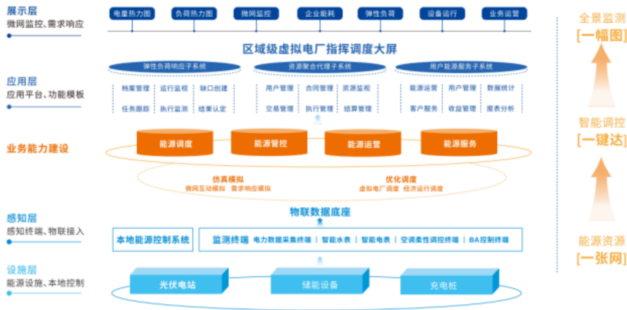
图3-1 倍特数智虚拟电厂平台模式