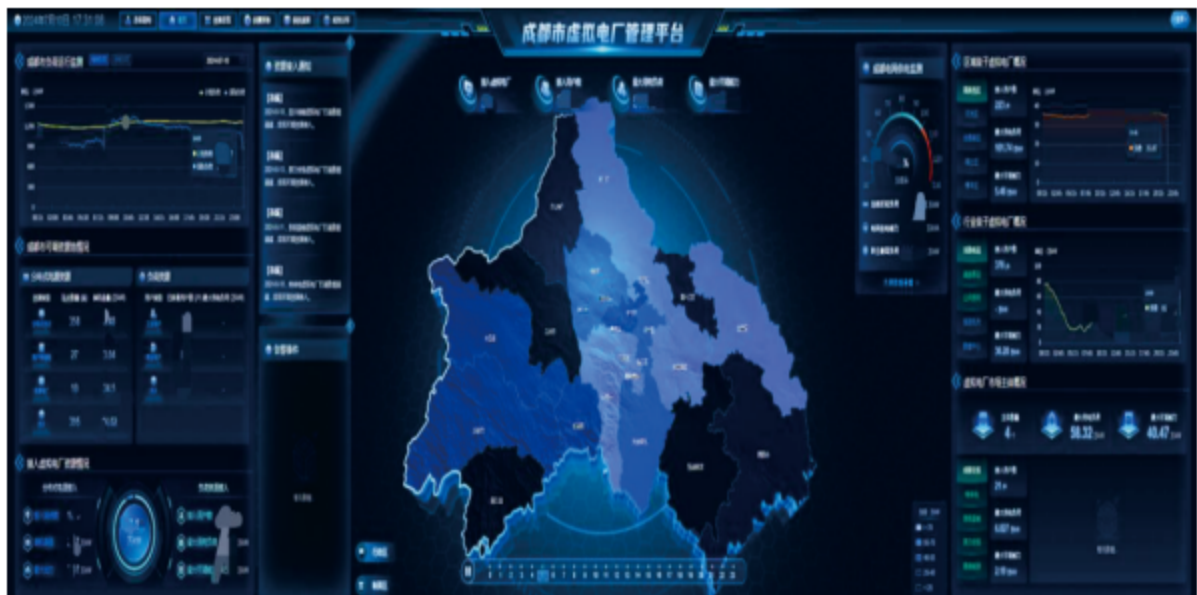
图 3-3 成都市虚拟电厂项目

2025年，在虚拟电厂领域，倍特数能自主研发的“倍特数智虚拟电厂平台”及解决方案，已逐步从成都高新区向外拓展，全年新增落地成都东部新区、简阳市等12个区域虚拟电厂项目，已成为区域市场重要的解决方案提供商，“倍特数智虚拟电厂平台”入选《全国工业领域电力需求侧管理典型案例（2025年）》的技术平台，为市场拓展储备技术动能；在储能系统集成领域，拓展工商业储能业务，参与建设四川时代60MW/120MWh工商业储能项目，并在电网侧储能领域实现市场拓展，在成都、简阳等区域市场打造多个标杆项目，形成了良好的示范效应，为后续储能市场拓展奠定基础。