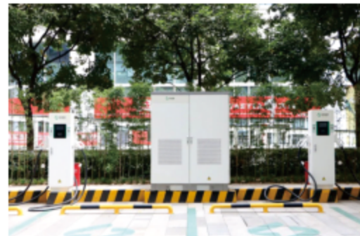
图 3-7 储能项目-善蓉汇超充站