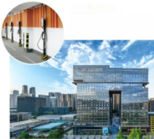
图 3-6 储能项目-天府新谷充电站