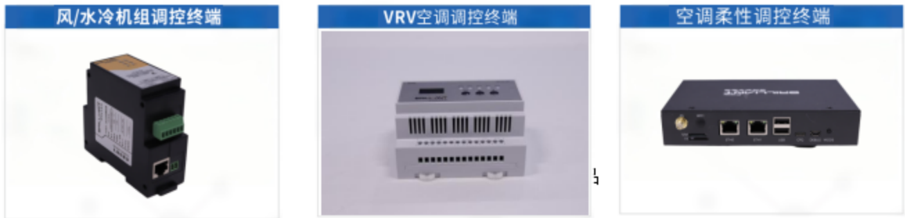
图3-2 倍特数智虚拟电厂平台终端产品

2025年，在虚拟电厂领域，倍特数能自主研发的“倍特数智虚拟电厂平台”及解决方案，已逐步从成都高新区向外拓展，全年新增落地成都东部新区、简阳市等12个区域虚拟电厂项目，已成为区域市场重要的解决方案提供商，“倍特数智虚拟电厂平台”入选《全国工业领域电力需求侧管理典型案例（2025年）》的技术平台，为市场拓展储备技术动能；在储能系统集成领域，拓展工商业储能业务，参与建设四川时代60MW/120MWh工商业储能项目，并在电网侧储能领域实现市场拓展，在成都、简阳等区域市场打造多个标杆项目，形成了良好的示范效应，为后续储能市场拓展奠定基础。