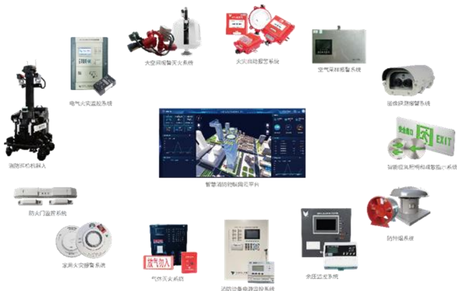
消防报警装备示意图

公司主营产品体系丰富、品类齐全，覆盖 AI 图像探测报警系统、极早期火灾探测系统、智能安消一体化巡检机器人、三水一电监测系统、火灾自动报警系统、大空间灭火系统、智能应急照明和疏散指示系统、电气火灾监控系统、消防电源监控系统、防火门监控系统、余压监控系统，以及智慧消防物联网平台、智慧消防远程值守平台等，全方位满足不同场景下的消防安全防控、监测、预警与处置需求。