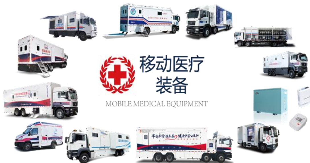
移动医疗保障装备示意图

公司现已具有配置全科甲级移动医疗和医疗应急处置能力，产品也正在向高端智能方向发展，能够提供整套移动医疗应急救援保障方案，目前也是全国移动医疗保障装备最齐全的制造商。