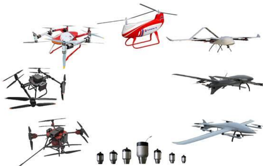
无人机装备示意图

公司瞄准低空经济中的应急救援重要应用场景，研发了大载重长航时多旋翼无人机、大载重纵列双旋翼无人直升机、垂起、多旋翼无人机等。产品可应用于消防灭火、应急救援、物流运输等领域，可搭载物流运输箱满足物流场景需要；搭载救援担架、安全舱，以满足应急救援需求；搭载灭火弹以应用于森林消防；搭载泡沫消防带以满足城市高层住宅灭火需求等。该型无人机可以与应急救援保障装备业务协同作战，是应急救援市场未来的重要发展方向。