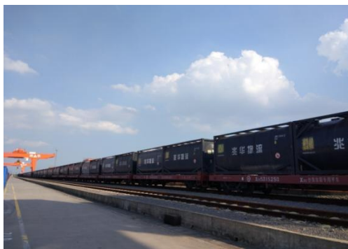
兆华集团沥青特种集装箱物流

公司现代物流业务中，全资子公司兆华集团从事的沥青供应链业务占比较大，兆华集团立足于沥青产业，以沥青特种集装箱的物流服务、沥青的改性加工与仓储、基质沥青产品仓储及电商平台为主要业务，相互结合，相互促进，构建了沥青供应链的完整业务链条。其业务模式主要是：从上游石油炼化企业（炼厂）通过集采分销的方式采购基质沥青，经过运输、仓储、改性加工，以战略合作与参加投标等方式获得业务机会，有针对性地向下游道路施工企业供应符合其需求的沥青产品。兆华集团拥有丰富的行业经验，对各类型客户的需求理解深刻，借助其沥青特种集装箱物流的核心优势，整合资源，完善物流网络，根据客户需求提供定制化的沥青供应链解决方案，持续打造高品质沥青供应链服务。