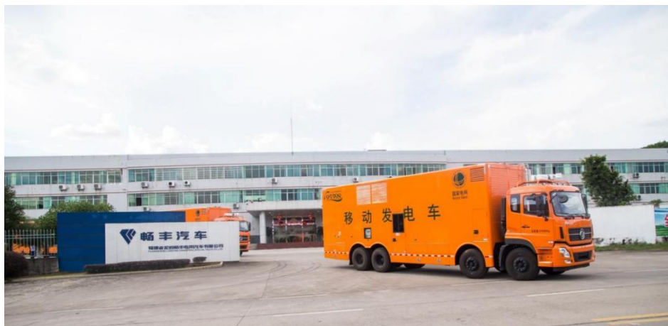
畅丰专汽移动发电车