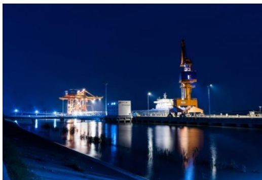
安徽中桩物流港码头