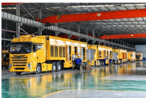
畅丰专汽应急电源车

公司全资子公司畅丰专汽主营专用汽车的研发制造，畅丰专汽为国家级高新技术企业、国家“专精特新”重点小巨人企业、国家知识产权示范企业，主要生产应急电源车、移动储能充电车、电力工程车、旁路作业车、无人机巡检指挥车、应急通信车、抢险救援照明车、大流量排水抢险车等应急装备车辆。畅丰专汽是国家工信部许可的专用车生产企业，是中国一汽、二汽、中国重汽、江淮汽车等大型车企的定点改装车辆厂，是国内重要的特种车辆设备和应急服务的提供商、国家援非电力应急装备制造商。公司产品行销国家电网、南方电网、国家应急管理部所属各救援队、国内“三大”通信运营商、大型矿山及油田等。