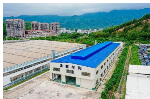
畅丰专汽涂装车间