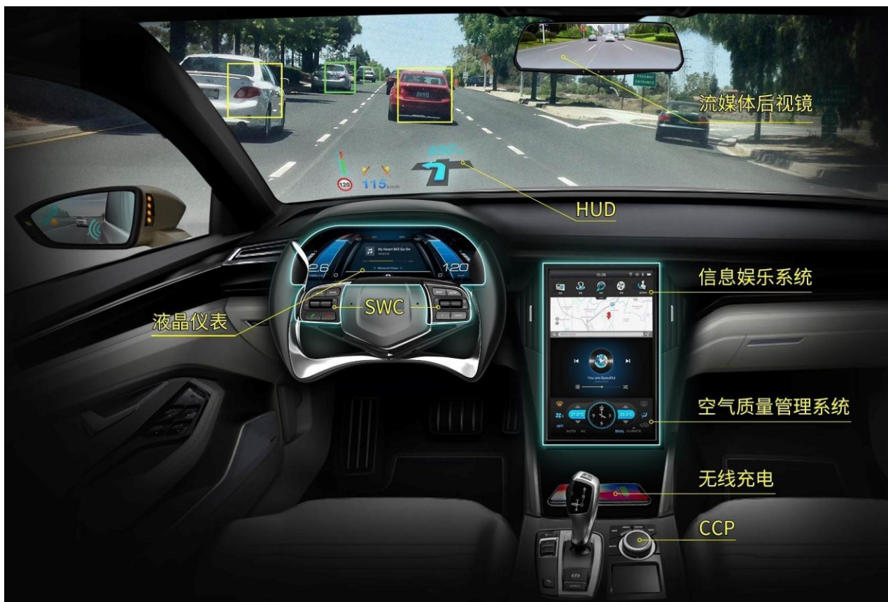
产品在驾驶舱内的应用场景区示意图