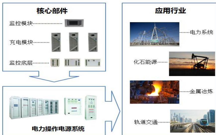
图3 电力操作电源产品核心部件及应用行业

以电力操作电源为核心部件的电力一体化电源系统是指为发电厂、变电站的电力自动化系统、高压断路器分合闸、继电保护装置、自动装置、信号装置、通信系统、遥控执行系统及事故照明等设备提供交流电源、直流电源、交流不间断电源的电力自动化电源设备，其可靠性、安全性直接影响到电力系统供电的可靠性和安全性。