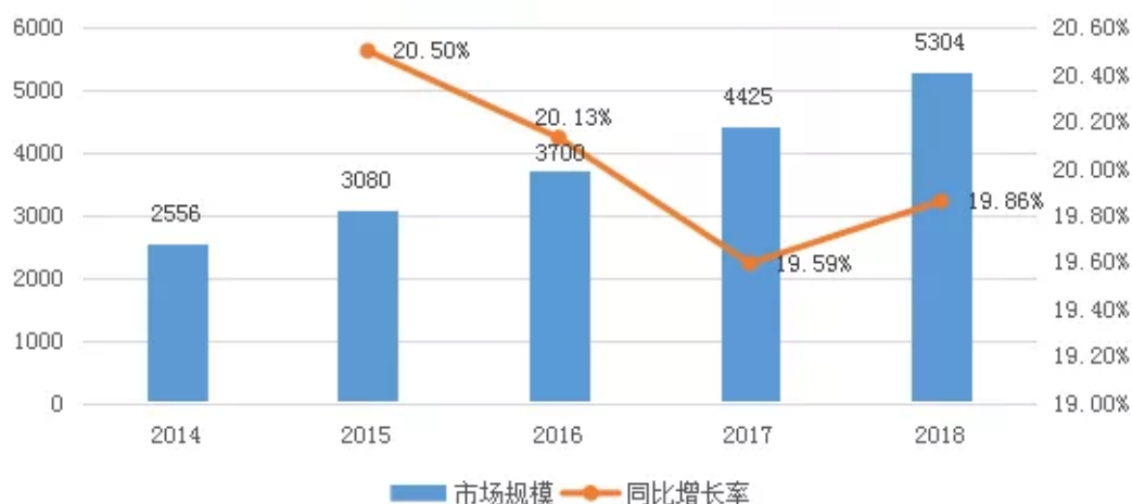
图1 中国医疗器械市场规模情况（亿元）

据医械研究院测算，2018年中国医疗器械市场规模约为5304亿元，同比增长19.86%。根据中国医药物资协会的统计，我国医疗器械市场规模从2001年的179亿元增长至2017年的4440亿元，年均复合增长率约为20.8%，大幅超过全球医疗器械市场平均增速。据Evaluate Med Tech 统计，全球医疗器械和医药的消费比例约为1:1。据IMS Health统计，2016年我国整体医药市场规模（不包括保健品、中药饮片、个人护理、器械）为12850亿元；以我国医疗器械市场总规模2016年约为3700亿元计算，医疗器械和医药消费比为0.3:1，远低于全球水平，由此来看，中国医疗器械市场仍有很大的发展空间。