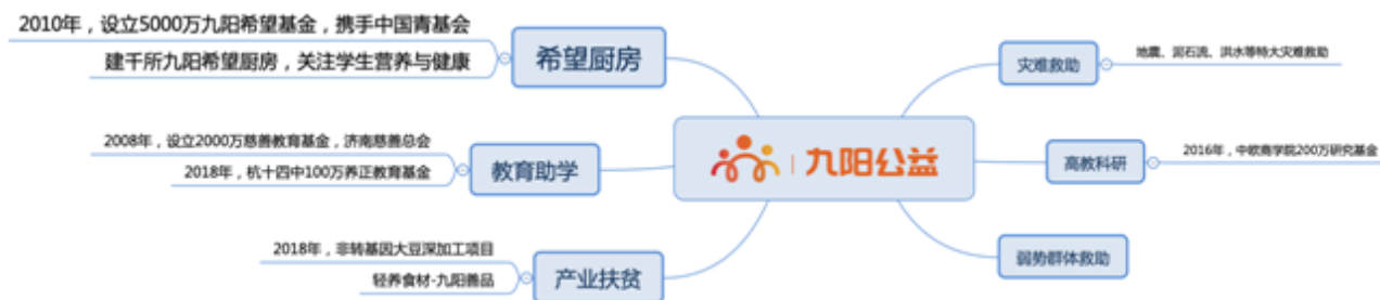
#九阳公益扶贫矩阵#

九阳精准扶贫聚焦在“教育”、“健康”为主题布局公益扶贫项目，通过系列健康与教育公益项目“精准扶贫”将作为九阳公益一直持续的聚焦点。发掘自身优势，在脱贫攻坚战中贡献九阳力量。