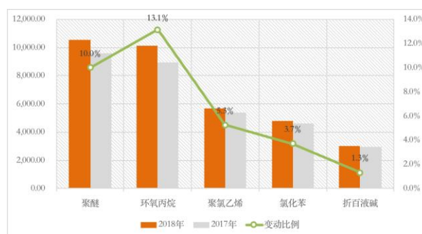
图 主要产品平均售价（单位：元/吨）

报告期内，公司成立销售管理部，并实施更加灵活机动的销售策略，在稳定老客户的同时加大直供客户开发力度，减少中间供应商，扩大利润空间；通过人员优化和新的绩效激励办法，增强业务人员的工作积极性和服务意识，增强客户粘性。报告期内，公司共增加直销客户134家，主要产品的平均售价与上年同期相比均有不同程度的增幅。