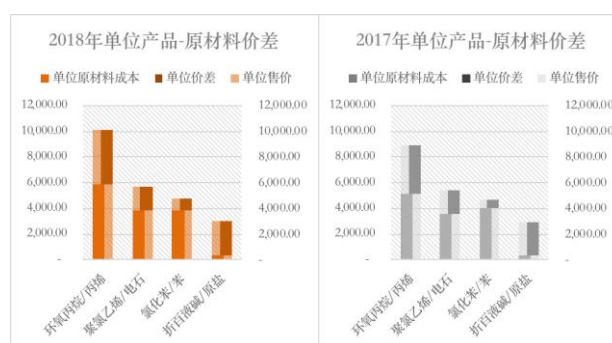
图 主要产品单位价差

在精细化管理、效率创造效益的原则下，公司简化了物资采购流程，推行框架采购，缩短了采购周期，报告期内累计降低采购费用近千万元。