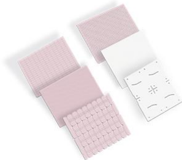
图为片式电阻用陶瓷基片