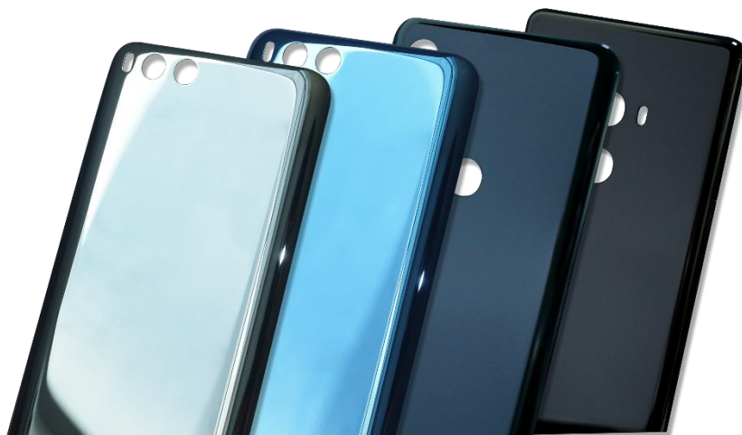
图为手机陶瓷后盖，源自公司内部资料

2018年，在市场需求以及国家政策大力推动下，5G建设及商用化进一步加速。5G技术商业应用极其广泛，从娱乐到物联网，再到云服务行业，5G的建设拉动产业链的需求增长。受益于5G建设，光通信市场持续保持平稳增长，公司相关产品销售规模继续得以提升。报告期内，公司不断提升手机陶瓷后盖产品的工艺技术，并召开了“三环火凤凰2.0发布会”，推出了主打新颜色、新工艺、新效果的迭代升级版“三环火凤凰2.0”陶瓷材料，在同等级结构下，“火凤凰2.0”陶瓷的重量比以前可减轻30%左右，在工艺效果及颜色方面都取得了新的突破，为客户提供更多样化的产品设计方案。