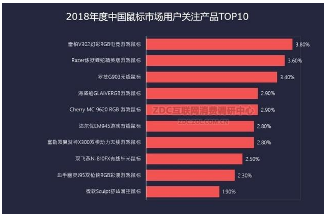
数据来源：互联网消费调研中心数据 ZDC 2018

2018年的键盘产品更加注重市场细，各种新轴体层出不穷，竞争激烈。ZDC数据显示，100-199元价位段键盘是众多用户关注的焦点，而99以下低价位键盘也拥有不错的关注度。ZDC互联网消费调研中心数据显示，雷柏键盘在2018年度中国键盘市场品牌关注中排名第一，占据了16.1%的关注度，表明了雷柏强大的品牌效应及产品实力。公司不断改善产品性能，通过提升机械键盘的生产技术，持续降低成本，目前200元以内价格段的产品已经基本被雷柏所占据，雷柏产品所拥有87键、104键、背光、RGB、游戏等属性，其他品牌若想再进入这块区域难度较大。