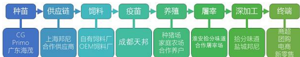
（图为公司全产业链协同发展布局）

报告期内公司主营业务和产品未发生重大变化，公司继续以生鲜猪肉及肉制品为主体、水产品为补充进行产业链的搭建和完善。