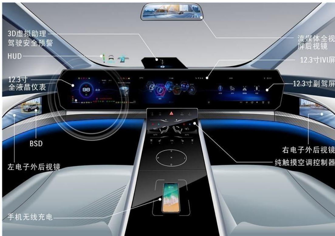
产品在驾驶舱内的应用场景示意图