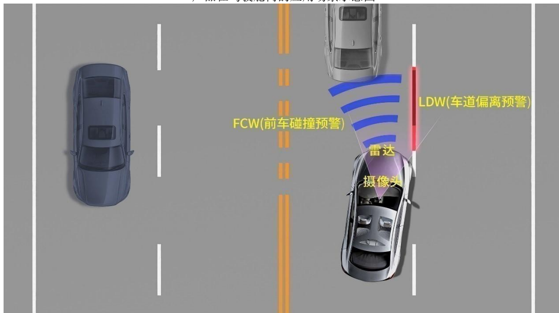
产品在驾驶舱外的应用场景示意图

2、精密压铸板块目前拥有汽车关键零部件、精密3C电子部件等较全面的产品线。汽车关键部件主要用于汽车底盘系统、汽车转向系统、汽车发动机及变速箱、汽车传动系统、智能钥匙、新能源三电系统（电池、电机、电控）等；精密3C电子部件广泛应用于包括航空、机械、电子、光通信等行业在内的各类连接器及结构件等，竞争力持续提升。