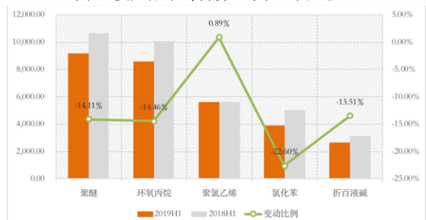
图 主要产品平均售价（单位：元/吨）

报告期内，为减弱宏观市场波动对公司经营业绩的影响，销售部和销售管理部积极开发新客户，并通过提升服务水平增强客户粘性。报告期内，公司共新增客户93家，其中直营渠道客户75家。