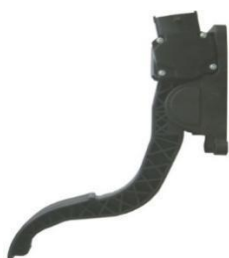
悬挂式电子油门踏板总成 (应用于乘用车：通用新赛欧)