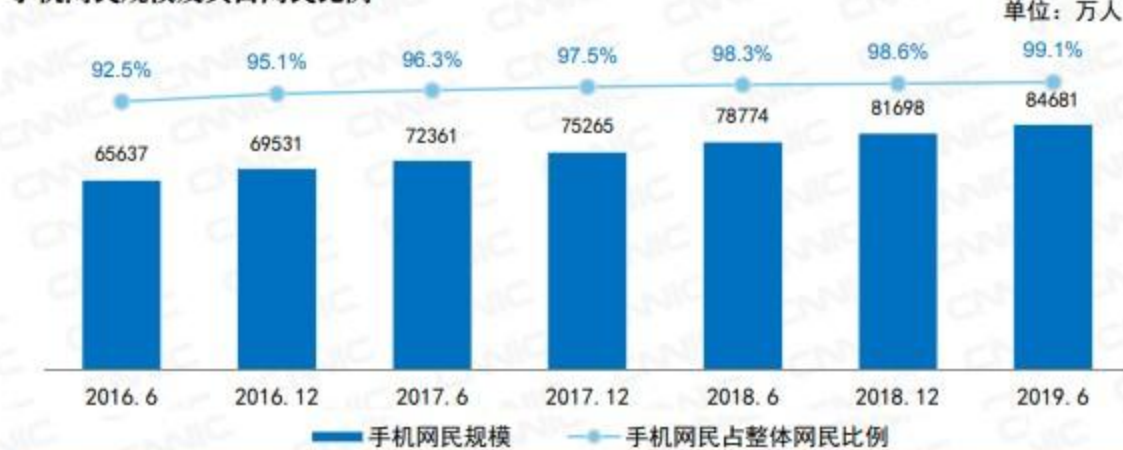
手机网民规模及其占网民比例

截至2019年6月，我国手机网民规模达8.47亿，较2018年底新增手机网民2,984万人。网民中使用手机上网人群的占比由2018年的98.6%提升至99.1%，网民手机上网比例继续攀升。如下图所示：