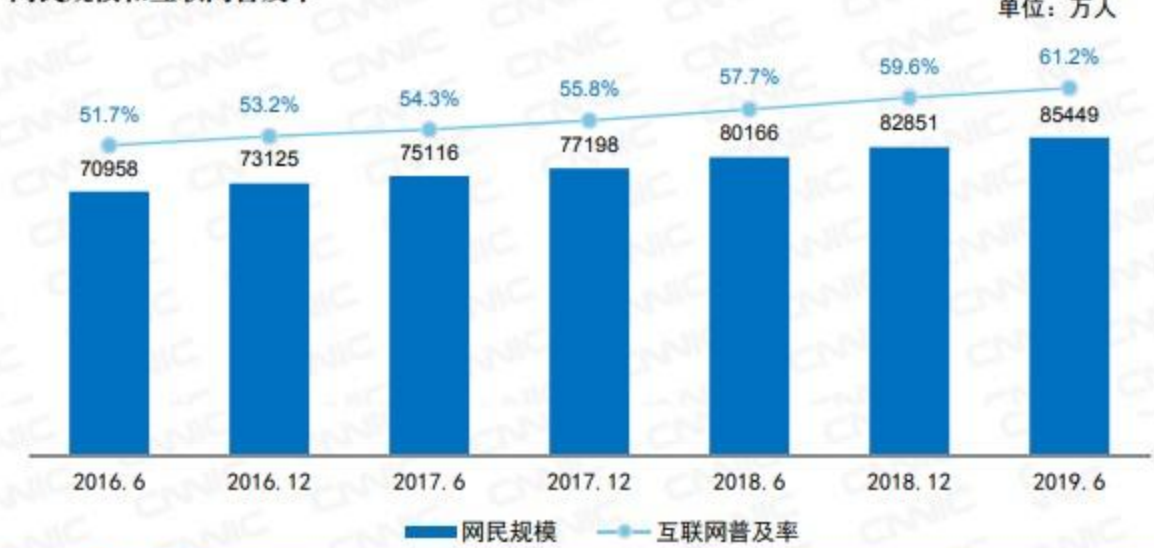
网民规模和互联网普及率