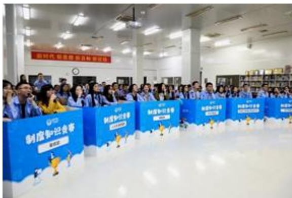
图为公司举办制度知识竞赛