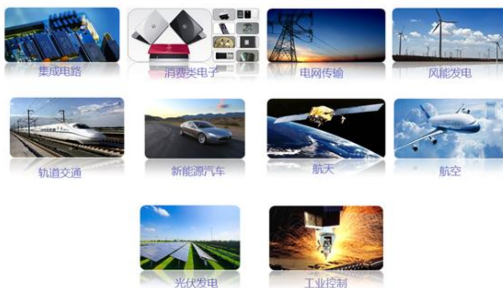
公司产品应用领域

公司主要产品包括半导体材料、半导体器件、新能源材料、新材料的制造及销售；融资租赁业务；高效光伏电站项目开发及运营。产品的应用领域，包括集成电路、消费类电子、电网传输、风能发电、轨道交通、新能源汽车、航空、航天、光伏发电、工业控制等产业。