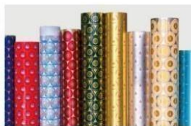
复合型防伪印刷铝板