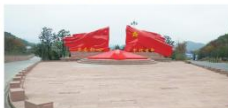
遵义苟坝红色文化旅游创新区建设项目