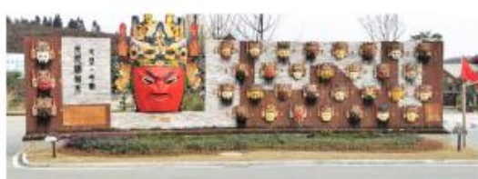
贵州安顺 邢江河国家级湿地公园项目