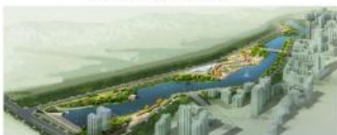
巴州区津桥湖城市基础设施和生态恢复建设项目 鸟瞰图