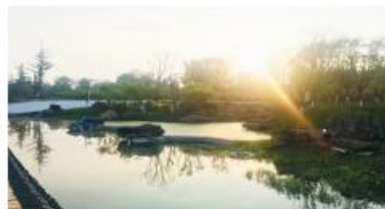
修文县小箐乡崇恩森林公园建设项目