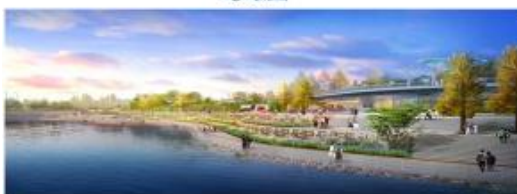
巴州区津桥湖城市基础设施和生态恢复建设项目 滨河休闲广场效果图