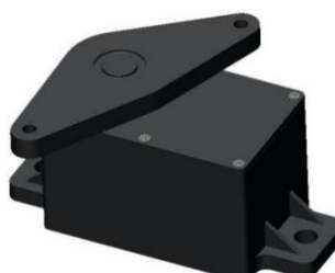
手动式电子油门踏板总成 (应用于中国重汽豪沃)