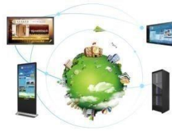
鸿合校园数字媒体发布系统