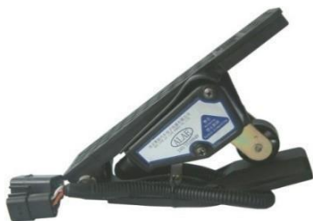
踏板式电子油门踏板总成 (应用于商用车：一汽解放J5M)