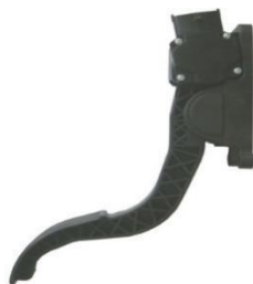
悬挂式电子油门踏板总成 (应用于乘用车：通用新赛欧)