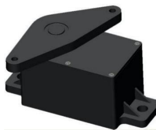
手动式电子油门踏板总成 (应用于中国重汽豪沃)