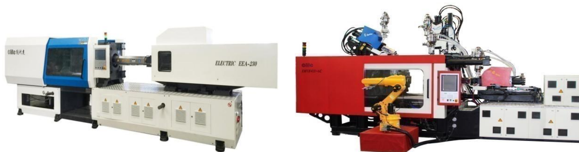
图3：公司的注塑机产品节选

自动供料系统是公司根据客户厂房环境、现场机台的摆放情况和现场原料用料情况，结合公司自产的各类特有注塑机、配套设备及直角坐标机器人，设计的一种能够实现全厂无人化不间断作业的生产车间整体解决方案。该系统采用工业电脑自动对所有机台进行集中控制，实现了对所有用料单元的24小时连续自动化供料作业，配合系统中各注塑机配套设备的不同功能，实现“原料→储存→计量→干燥→输送→成型→物流”全过程的自动化生产。