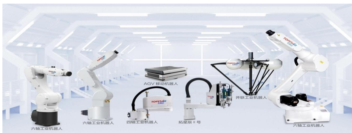
图1：公司的多关节机器人产品节选

2) 直角坐标机器人产品描述：直角坐标机器人又称为机械手，它能够实现自动控制的、可重复编程的、运动自由度间成空间直角关系的、多用途的操作机。公司自主研发、生产的直角坐标机器人采用伺服马达驱动，使用皮带、齿轮、齿条进行传动，并配备高精密线性滑轨以导向运行，使产品具有定位精准、运动速度快、运行稳定等特点，可应用于直线、平面、立体的工件搬运移栽、检测定位、自动装配等工序。