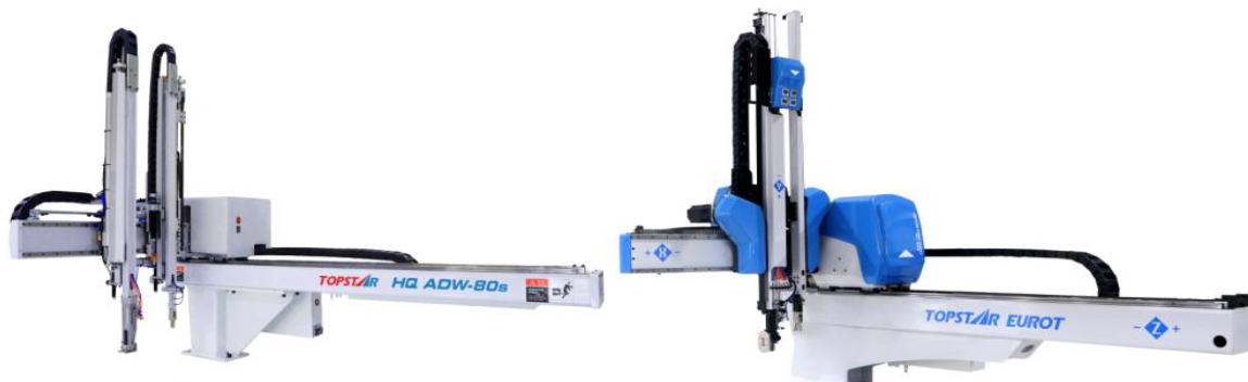
图2：XYZ三向伺服控制五轴机械手

报告期新品：公司于报告期内开发，并于2019年5月推向市场的HQ系列直角坐标机器人。HQ系列，提升了设备标准化，大幅缩减物料类别、设备型号和定制化维度等，通过规模销售、技术支撑和供应链整合，产品价格透明化并同步降低了生成成本，保障自身产品竞争力和利润率的同时，开启市场竞争格局的重塑。