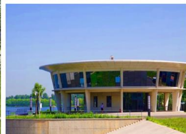
▲ 北京通州·北运河甘棠橡胶坝改建工程