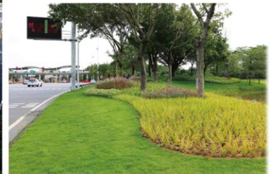
▲ 广东东莞·东莞大道绿脉提升工程