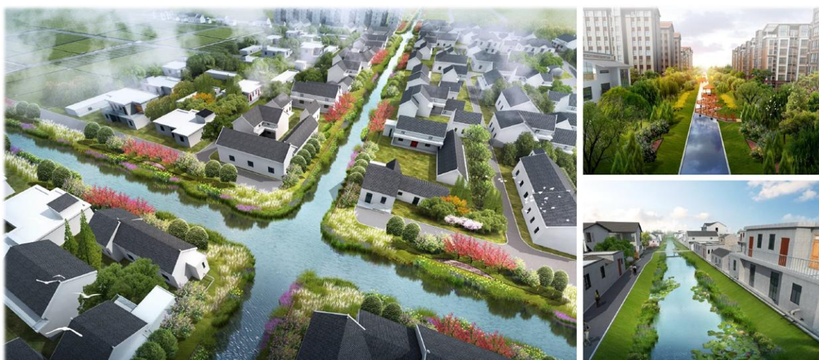
▲ 江苏盐城·亭湖区水环境综合整治

文化旅游业务： 该业务板块涵盖主题文化旅游的规划设计，主题文化景区（主题公园）的创意设计、旅游投资、景区建设、策划营销和运营，高科技文化创意产品，特种影视，全球活动创意及展览展示，应急数字减灾等。恒润集团和德马吉与公司在战略、业务、人才、资源等多方面协同发展，均取得良好的业绩发展。其中，恒润集团启动并于2020年1月完成了股份制改造，自主投资、建设、运营项目稳步落地推进，高科技主题文化游乐等业务获得更多知名客户认可；德马吉全球会展、文旅综合固展、智能文娱等业务亦取得良好的成绩。未来，文旅板块将成为公司业绩利润的重要增长点。