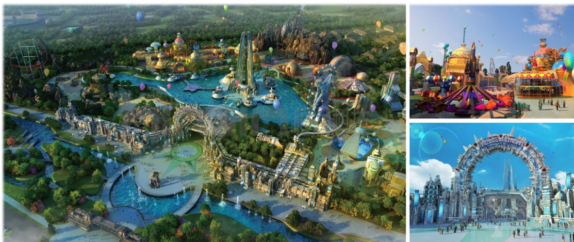
▲ 山东日照·科幻谷项目