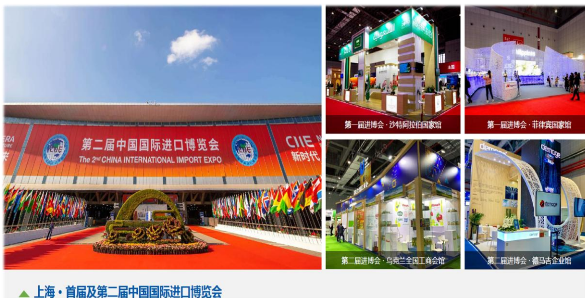
▲ 上海·首届及第二届中国国际进口博览会