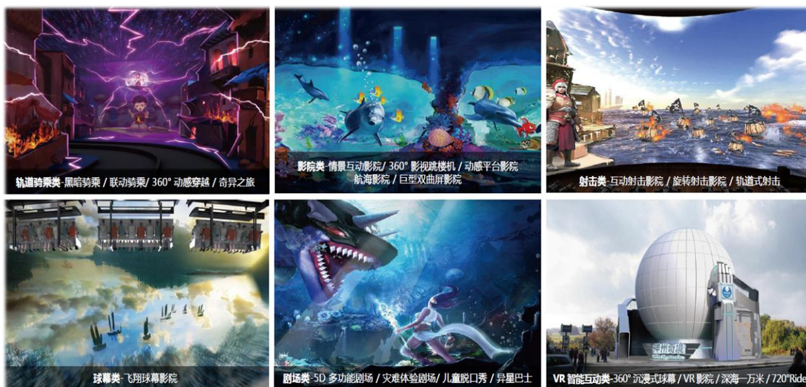
▲ 高科技文旅产品定制