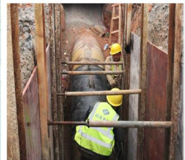
▲ 广东东莞·东引河流域樟村断面综合治理工程（污水管网完善工程第四标段）