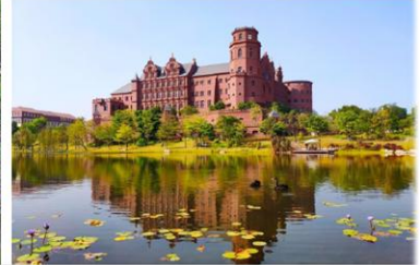
▲ 广东东莞·松山湖“华为小镇”景观工程