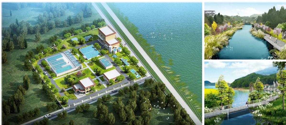
▲ 四川南充·嘉陵区城乡环境综合治理