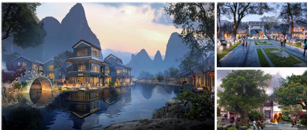
▲ 广西贺州·黄姚龙门街项目