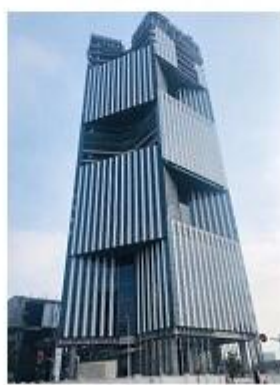
上海新开发银行总部大楼