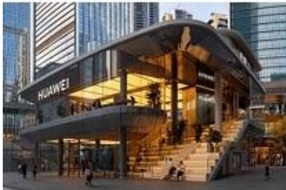
深圳万象天地——华为全球旗舰店