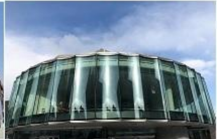
美国丹佛艺术博物馆