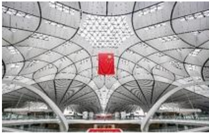
北京大兴国际机场