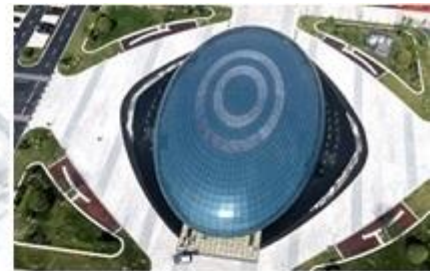
海安机器人及智能制造科创服务中心