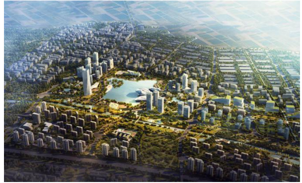
图 1-2 成都高新西区产城融合核心区示意图

结合公司“TOD站城一体开发”方面的设计经验，完成了深圳大运枢纽、平湖枢纽等重点片区的站城一体化设计。在企业客户方面紧密服务中国铁路设计集团有限公司、华润置地有限公司、万科集团等知名大型企业，并成功同多家国际知名设计机构建立战略合作，共同开发市场、优势互补、共同发展。