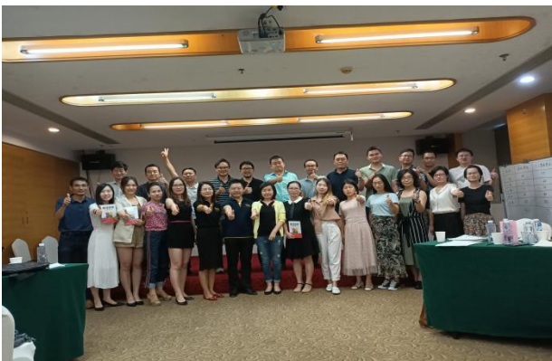
图5-5 《DISC与团队效能》内训

员工的成长是公司的根本。公司不仅仅关注员工的工作业绩，也重视员工的幸福感与归属感，快乐工作，幸福生活。公司始终秉承着“尊重知识、尊重个性、集体奋斗”的核心价值观，定期开展专业讲座，积极组织各类健康运动及赛事、读书思考、学习传统文化等活动，为员工的健康成长、公司业务的蓬勃发展创造必要的组织氛围与人文环境。