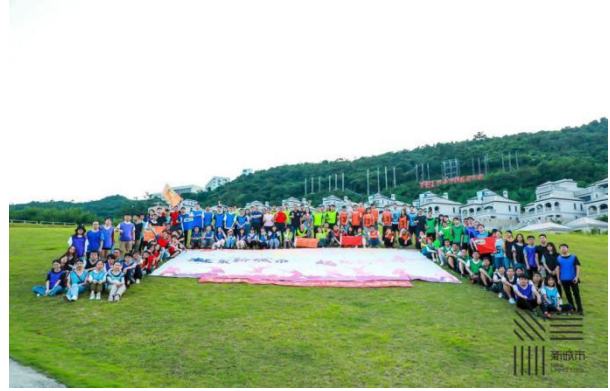
图5-2 年度新员工拓展培训

公司持续打造加强岗位和技能培训的学习型氛围，不断地提高员工的整体素质。报告期内，公司共举办各类培训场次达26项，培训人员达400余人次，开展包括行业大咖讲座、行业论坛、内部骨干员工经验分享等专业技能类培训；员工拓展训练、团队管理、性格测评等综合素质类培训。此外，公司聘请了外部顾问积极进行公司战略规划，人力资源部紧随公司战略步伐，有序完成系统人才盘点，组织架构优化，人事管理制度完善等各项工作，夯实推动公司发展的人才基础。