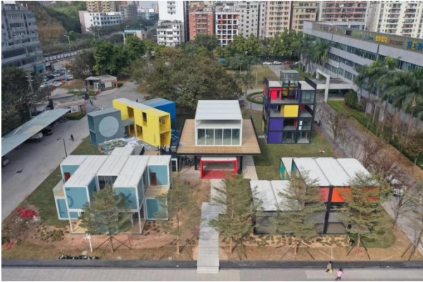
图 4-1 深港双年展分会场

报告期内参与多项提升公司品牌活动，2019年12月深港双年展，我公司受邀协助并参与了“站城一体”板块的策展和布置工作，分享了近年来“站城一体”开发的实践工作，以更好地对外宣传“站城一体”开发理念和深圳经验，推动站点建设和周边城市的融合发展，实现未来更高质量的建设。（注：深港城市/建筑双城双年展（深圳）是深圳与香港双城互动一展两地的展览，以关注城市和城市化为使命，用当代视觉文化的呈现方式，深度展示深港、中国乃至全球城市化进程和人居状态的各个方面，是全球唯一“城市/建筑”双年展）