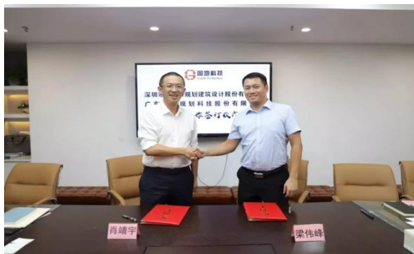
图2-1 与国地科技签约仪式

公司持续关注市场机会，不断寻求与公司主营业务相关的企业开展业务方面的深度合作、战略合作，着眼协同增效，为公司培育新的利润增长点。2019年6月，公司与广东国地规划科技股份有限公司（以下简称“国地科技”）签署战略合作框架协议，双方将在地理测绘、国土规划、信息系统开发集成等方面的优势进行资源整合；同时，公司与云南震安减震科技股份有限公司（以下简称“震安减震科技”）达成战略合作意向，为建筑防震安全、保护人民财产通力合作。2019年7月，公司与中国联通控股的智慧足迹数据科技有限公司（以下简称“智慧足迹”）及深圳诺地思维数字科技有限公司（以下简称“诺地思维”）达成战略合作意向。与智慧足迹丰富多元的数据产品服务、诺地思维多源城市时空活动大数据采集处理、分析挖掘、可视表达等方面的优势进行资源整合，三方将依托优势数据资源、领先的模型研发能力，不断开展城市规划与交通领域的大数据行业应用研究和专题研究，提升行业大数据研究水平，开展创新应用与示范研究。2019年12月，公司与平安城市建设科技（深圳）有限公司签署合作框架协议，双方携手就智慧市政、智慧平台建设、智慧规划、智慧交通、产业供应链等领域开展合作，提高双方整体运营效率，在城市建造、规划、设计、交通以及科技创新等方向创造更大的商业价值。