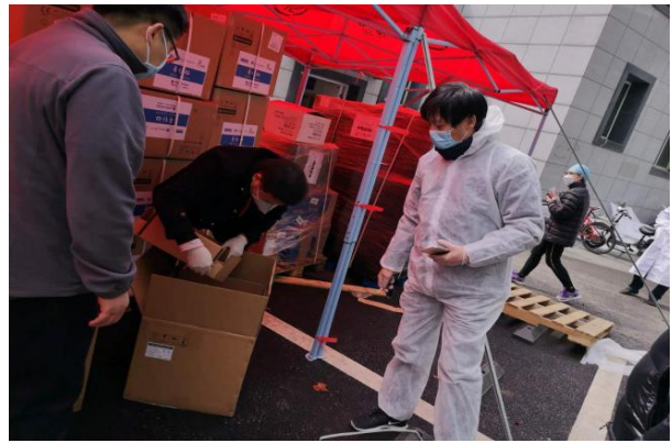
图6-2 武汉分公司参与抗疫工作

用心做企业，用爱做慈善，公司团体义工队成立于2014年，积极开展急救培训讲座，普及了高质量急救知识与急救技能；举行了环境保护（垃圾分类）等培训讲座、海绵城市研学公益活动，普及深圳在实践海绵城市的建设及保护生态环境的紧迫性。新城市勇担社会责任，主动参与扶贫救困、精准帮扶工作，2019年12月对广西靖西村进行爱心捐款的公益行动。共计发布义工活动41次，引领员工用奉献完善自我，温暖他人。