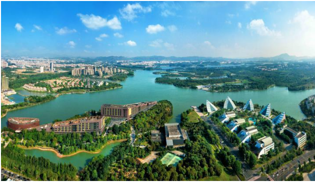
图 1-1 松山湖园区核心区现状

实施方案。因时而异、因地制宜地系统研究了促进产城融合的政策指引和实施路径。这一系列工作丰富了我司产城融合实践经验，为同类型地区推进产城融合发展树立了范式，也有效地拓展了当地政府客户。