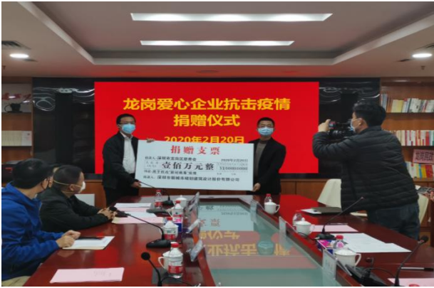
图6-1 公司抗击新冠肺炎疫情捐赠仪式