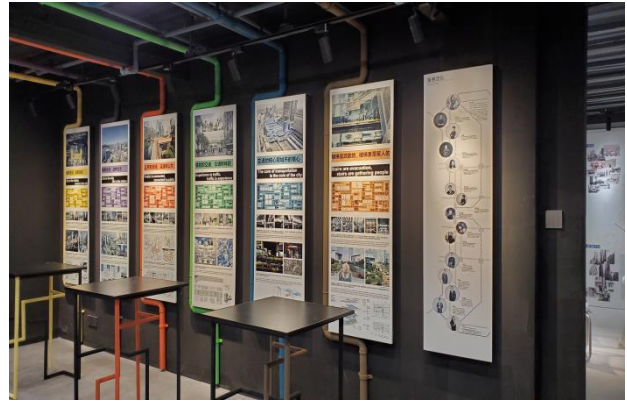
图 4-2 “站城一体”展厅内部