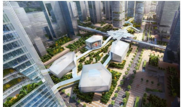
图 1-2 大运枢纽站城一体开发

结合公司在全过程咨询、综合解决方案方面的优势经验，完成了《深圳市宝安区市容环境品质提升》全过程咨询项目，指导宝安区城中村治理、立面景观、世界花城及灯光景观提升等539个工程建设，提供项目全流程管控服务。建立各专业服务协同模型，创建新型组织模式，整合建设项目全过程信息，充分发挥综合技术管理优势，多个竣工项目获深圳市嘉奖。