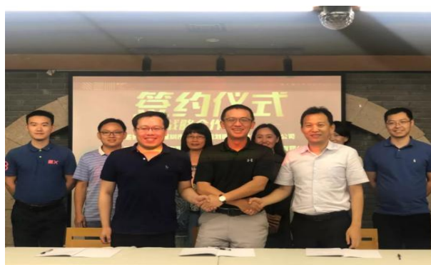
图2-2 与智慧足迹、诺地思维签约仪式

报告期内，公司完成首发上市，募集资金净额共计人民币47,965.69万元，公司的经营实力得到了大幅增强，公司的公信力和品牌知名度亦得以进一步提升，公司由此获得更多的发展契机，为打造“创意+科技+服务”为一体的国土空间和建设领域全程解决平台奠定了更为坚实的基础。未来，公司将依托现有的人员、技术及品牌优势，随同募投项目的逐步开展，加强多区域设计平台的新建、改扩建及新兴技术的运用，公司的市场占有率及收入规模有望持续提升。