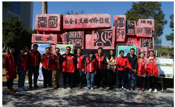
图6-4 海绵城市研学公益活动