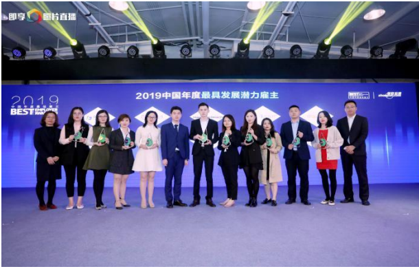
图5-1 公司荣获2019中国年度最具发展潜力雇主