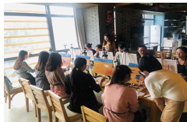
图5-6 公司员工绘画活动