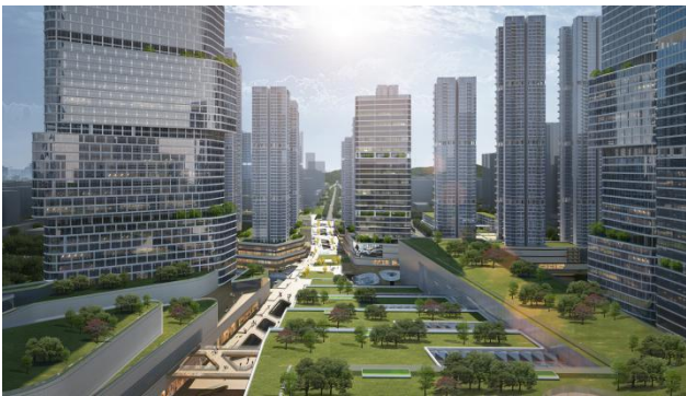
图 1-1 平湖枢纽站城一体开发

结合公司“TOD站城一体开发”方面的设计经验，完成了深圳大运枢纽、平湖枢纽等重点片区的站城一体化设计。在企业客户方面紧密服务中国铁路设计集团有限公司、华润置地有限公司、万科集团等知名大型企业，并成功同多家国际知名设计机构建立战略合作，共同开发市场、优势互补、共同发展。