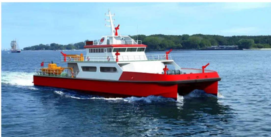
重庆消防总队40米级多功能消防指挥船