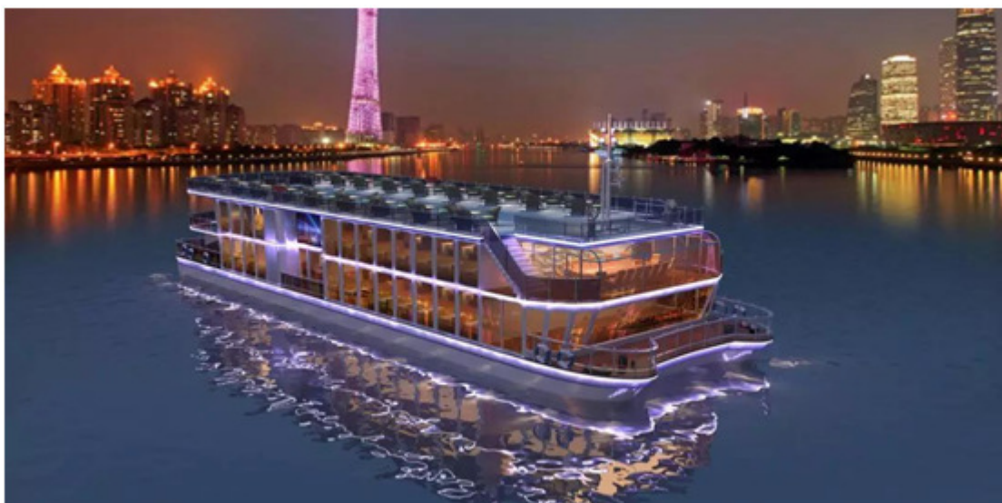
蓝海豚“珠江游”280客位纯电动游船