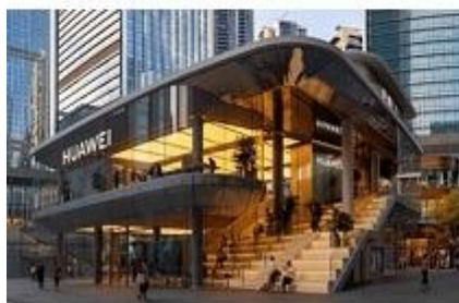
深圳万象天地——华为全球旗舰店