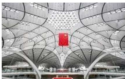
北京大兴国际机场