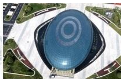
海安机器人及智能制造科创服务中心