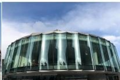
美国丹佛艺术博物馆