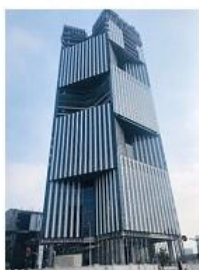
上海新开发银行总部大楼