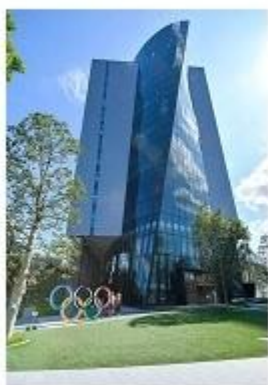
东京奥运会行政中心