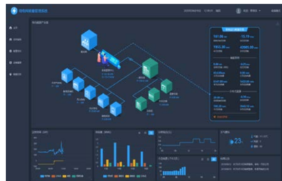
图 6：微电网能量管理系统 APP