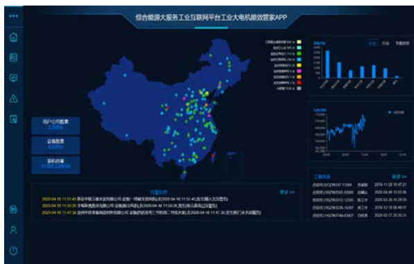
图 5：工业大电机能效管家平台 APP

以此项目为基础的“基于工业互联网平台的电力需求侧微网能量管理系统”项目被国家工业和信息化部列入的“2019年制造业与互联网融合发展试点示范项目”名录，建设基于综合能源大服务工业互联网平台，利用电力需求侧用户企业实时电力数据平台，整合用户生产、电力市场、气候环境的相关数据信息，加强能源需求侧管理，采用在满足生产电力能量要求的前提下的能量优化控制，实现实现能源动态分析及精准调度、负荷调整，进一步降低能源消耗，提高能源使用效率，有效降低电力用户企业在能源使用过程的运营成本。