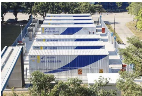
图 3：顺德五沙电厂储能系统

在储能电站领域，智光储能是级联型高压直挂储能技术的市场倡导与践行者，其高压级联型储能系统获得中电联组织的专家组“整体国际先进，部分指标国际领先”的评价。智光储能完成6kV储能系统、10kV储能系统、630kW高性能系列储能系统、6MW级储能检测平台、电池梯次利用储能系统的研制。6kV储能系统、10kV储能系统已通过中国电科院、广东电科院的现场技术测试，并承担相关标准的编制工作。报告期内五沙电热储能项目已投产，江苏万邦储能、茂名电厂、广州中新知识城粤芯电化学储能电站等储能项目正在建设中。