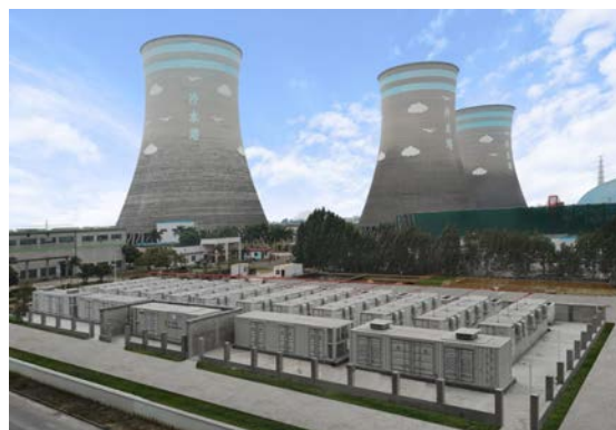
图 4：茂名电厂储能系统

在大容量SVC产品领域，完成高功率密度与高可靠性技术升级设计及升级后产品的投运，为后续进入更大容量SVC系统奠定坚实基础；基于GOOSE技术的第四代消弧控制器的样机研制工作基本完成，为后续消弧选线产品的功能与性能提升，提供了技术保障。