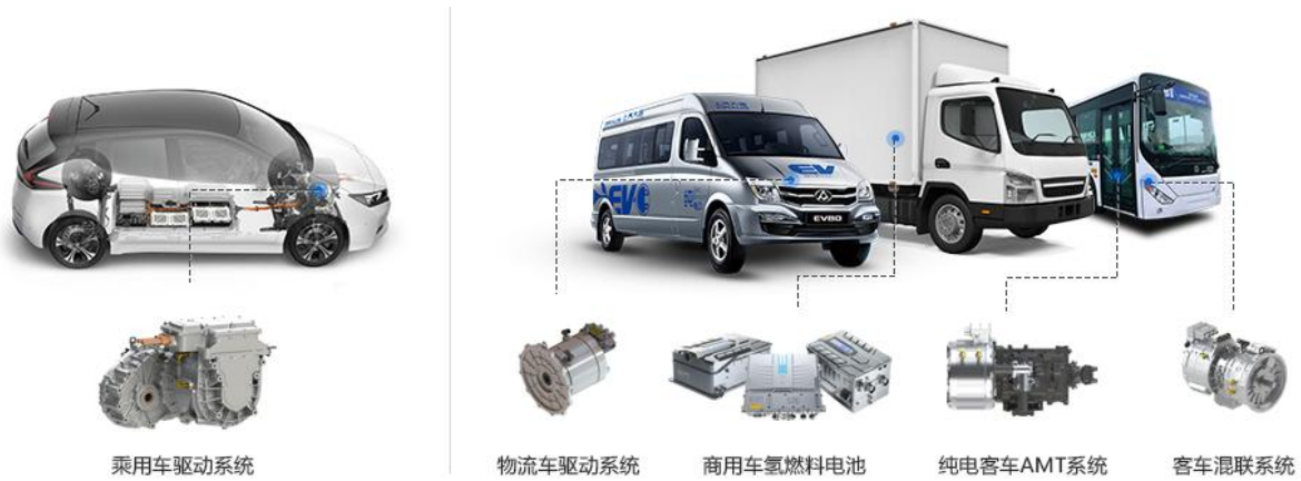
新能源汽车领域的应用