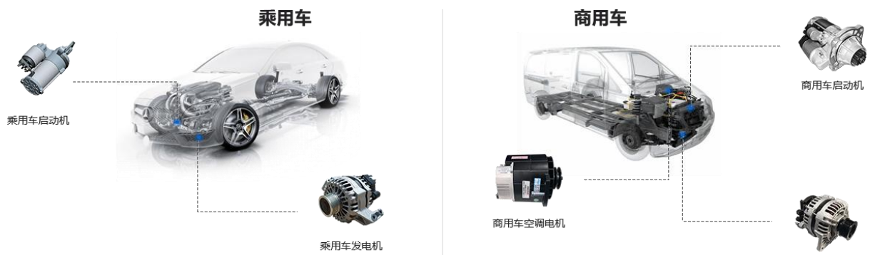
传统汽车领域的应用

3、氢燃料电池业务主要产品：氢燃料电池模组及核心零部件、氢燃料电池控制系统及氢能发动机集成系统等。