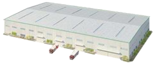
商业电动闸门电机