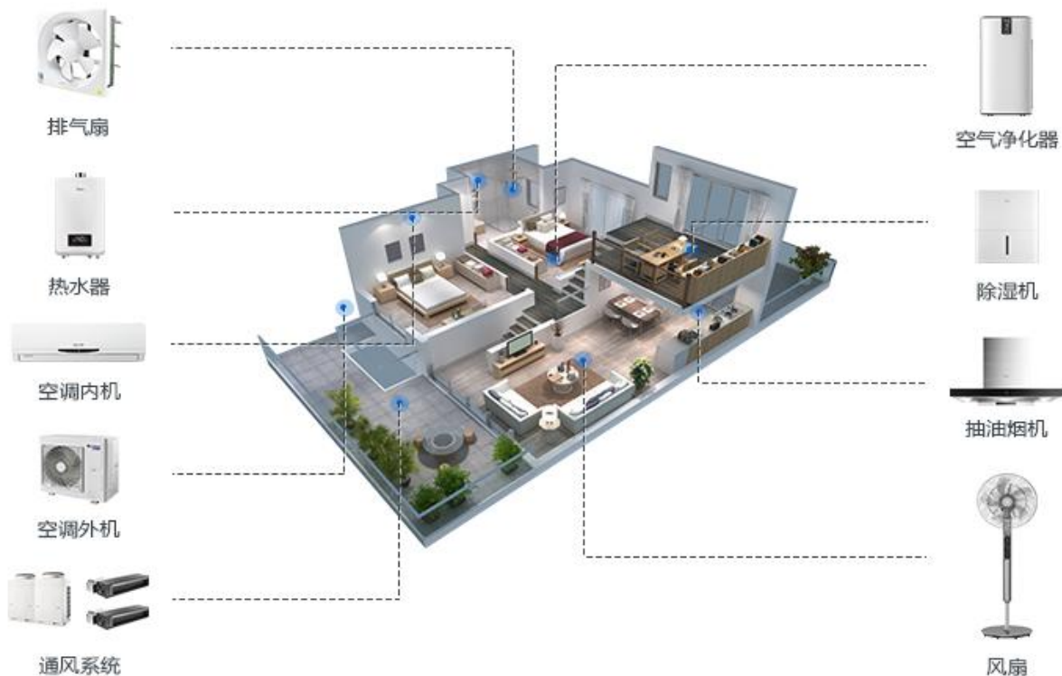
家居电器领域的应用

1、建筑及家居电器电机事业部（HM事业部）的主要产品：家用/商用空调用电机、建筑通风设备用电机、厨房电器设备用电机、自动车库门用电机、水泵用电机、商用空调用压缩机电机、暖气/通风系统及空调设备用高效率风机系统等。