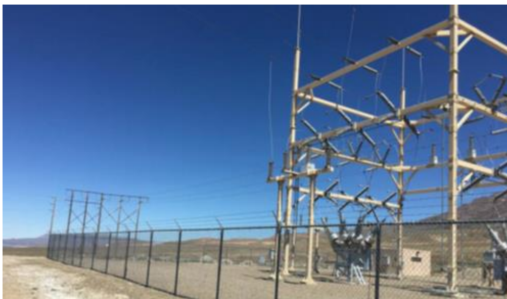
Star Peak项目电网公司接入站