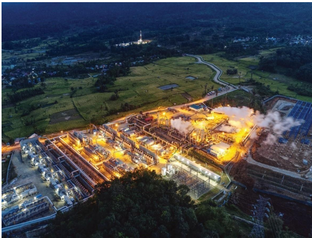
SMGP项目一期现场-夜景图

报告期内，SMGP项目还再次聘请了国际地热专家团队，根据项目前期打井显现的地热资源情况，开展了更多的勘探工作，包括更密集的MT（大地电磁）探测，以及之后的钻探勘探和评估，以准确揭示地热能资源储量，改进开发战略。更大的P90区域已经被高度证实，对整个项目实现开发240兆瓦地热发电具有重要意义。此外，SMGP项目还为开发井的钻探确定了新的位置，取得了更高的成功率。