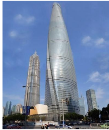
上海中心大厦使用的 防火玻璃幕墙