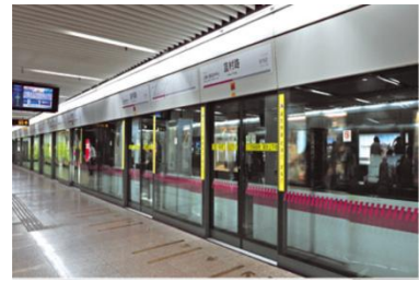
香港地铁中使用公司的 防火防爆地铁屏蔽门系统

金刚保安仓作为军、警用的专业防护产品，具有防护能力强，功能配置多，环境适应灵活等特点，是一款优秀的军、警用专业战斗防护堡垒，可运用于军事领域。