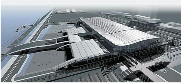
广州国际会展中心使用大面积的 高强度铯钾防火玻璃及Low-E防火玻璃