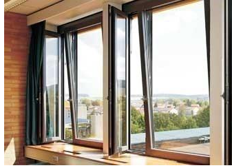
铝合金耐火节能窗