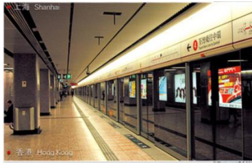
上海地铁中使用公司的 防火防爆地铁屏蔽门系统