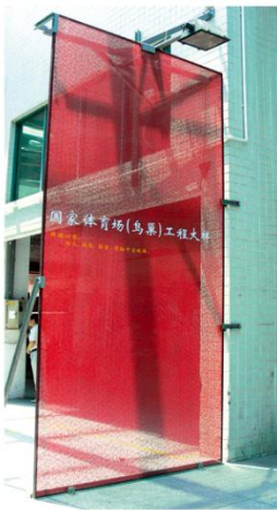
公司鸟巢工程大样