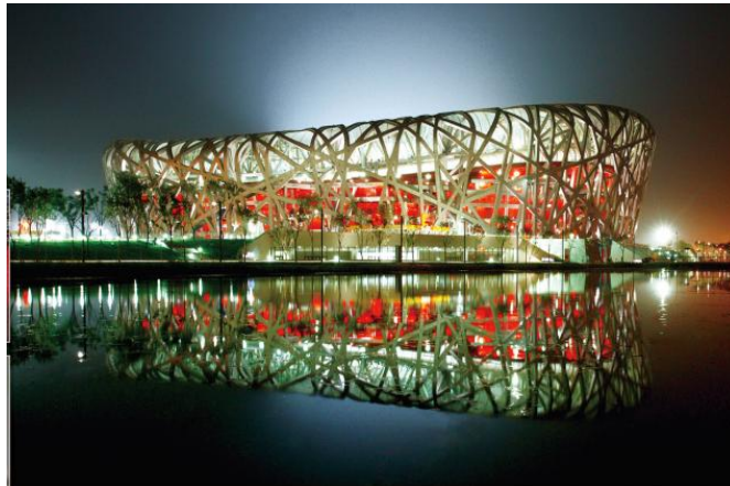
国家体育场（鸟巢）使用公司的彩釉钢化玻璃