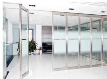
不锈钢防火玻璃平移门