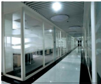
钢制防火玻璃门及隔墙

公司防火玻璃系统产品主要包括钢质防火玻璃及隔墙、隔热钢制玻璃门及隔墙、不锈钢防火玻璃门窗及隔墙、钢质节能防火窗、防火玻璃幕墙、单元式防火玻璃幕墙钢铝系统及高强度单片低辐射镀膜防火玻璃等。