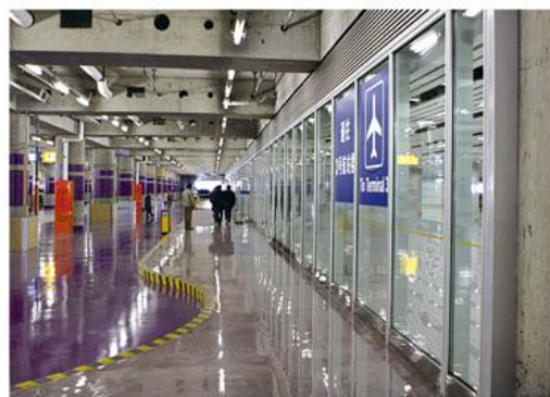
首都机场三号航站楼地下停车场使用公司防火中空玻璃隔断（带钢框架防火玻璃门）

截至2019年12月31日，公司承担过30多项国家级、省级科技项目；10项产品通过科技成果鉴定，其中8项产品综合技术达到国际先进或国内领先水平；列为国家重点新产品6项。