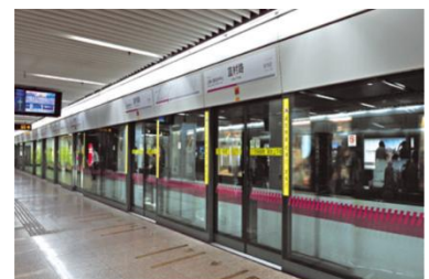
香港地铁中使用公司的防火防爆地铁屏蔽门系统