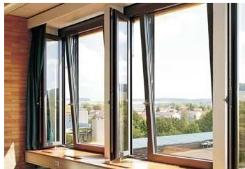
铝合金耐火节能窗