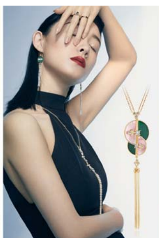
【雅致婉约 东方美人】