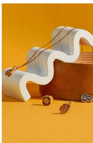
【新鲜多变 寓意吉祥】