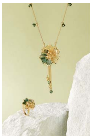
【含蓄考究 成熟丰富】