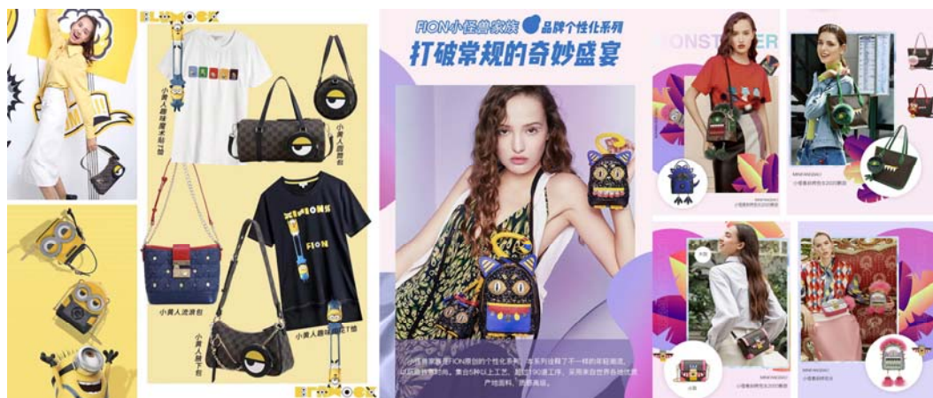
FION IP系列·演绎高级趣味

高雅简约、工艺精美的FION产品充分表现了都市女性独立的一面，每一块精选的上乘皮料，都经过多重繁复的步骤处理，融合最前沿的设计及匠师独一无二的手工，为新时代的女性创造出高雅精致的皮具。