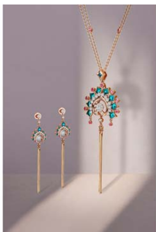
【国粹经典 惊艳回眸】