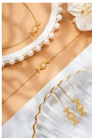
【精致工艺，时尚有趣】

1、“CHJ潮宏基”品牌创立于1997年初，系国内首家以K金钻石镶嵌、K金素金等时尚珠宝首饰为核心产品的珠宝品牌，以其卓越品质、创意革新和精湛工艺成为中国时尚珠宝艺术的象征，以“时尚近季·奢侈近人”的品牌理念，引领中国珠宝年轻时尚设计潮流。截至上半年“CHJ潮宏基”品牌共有883家线下珠宝专卖店和多个线上销售渠道，是公司最主要的核心业务。