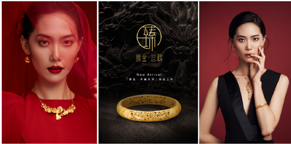
【精致黄金 精工绝艺】