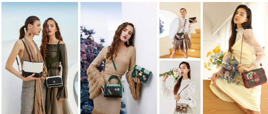
FION 经典系列·传承匠心工艺

3、“FION菲安妮”，1979年创立于香港，亚太地区知名女包品牌，FION以其一贯的精工品质和对细节的考究，一直以来深受都市白领女性所宠爱。2014年公司对其全面收购后，从品牌形象、产品设计以及渠道进行了年轻化战略调整。截至6月底国内共有300家门店、海外共有22家门店，在唯品会、天猫等线上渠道销量均位于前茅。