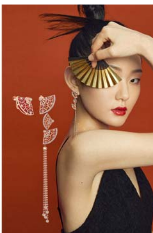
【东方韵味 气质优雅】