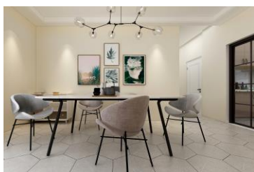
水性健康涂料-马卡龙系列