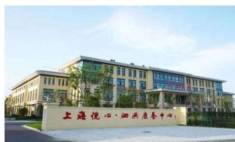
江苏泗洪康养中心项目