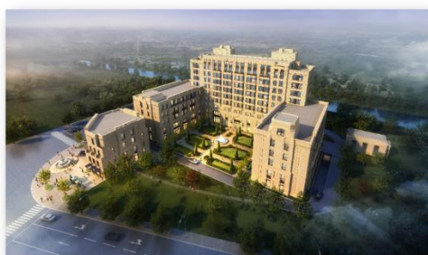
上海闵瑞路高端失智失能照护项目-安颐别业（在建）

公司养老服务业务以发展医养康教一体化、医养融合的连锁养老服务事业为核心，重点规划失能失智领域。目前业务以长三角区域为主，逐步扩展到其他区域。