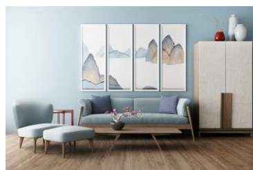
水性健康涂料-色浆系列