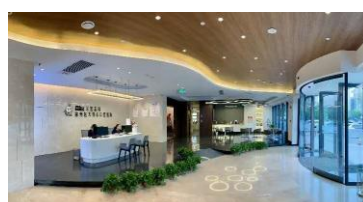
徐州医大悦心口腔医院