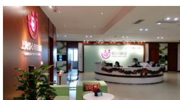
上海悦心综合门诊部